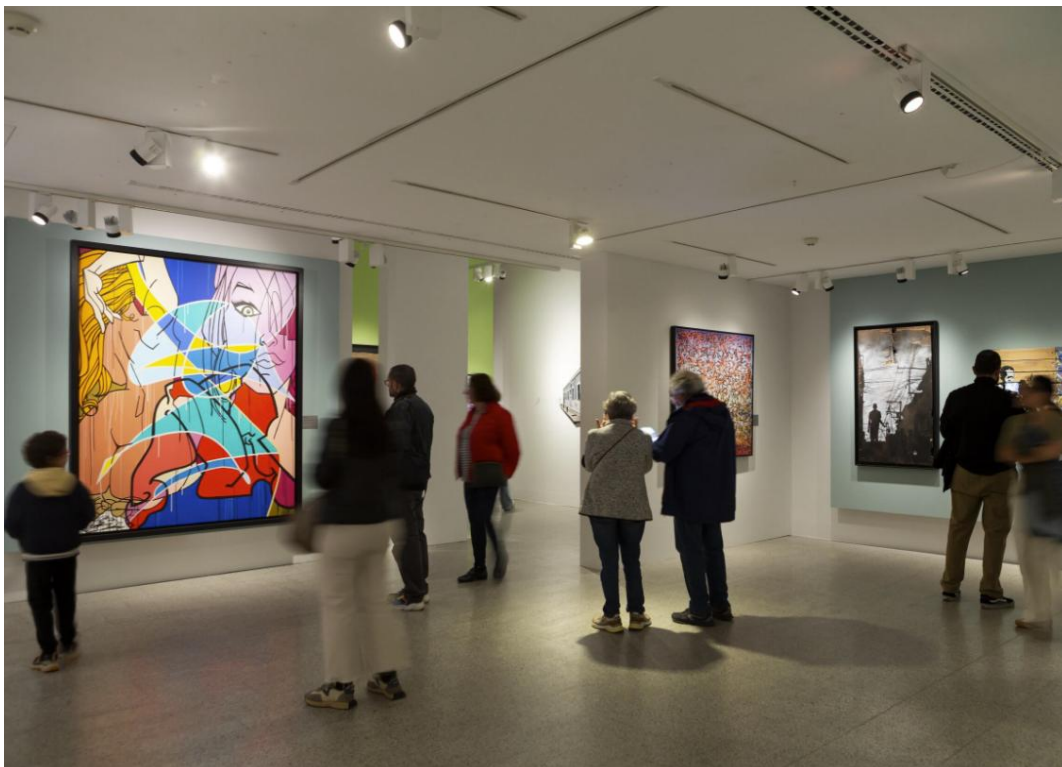
Imagen de la exposición Arte urbano. De los orígenes a Banksy .