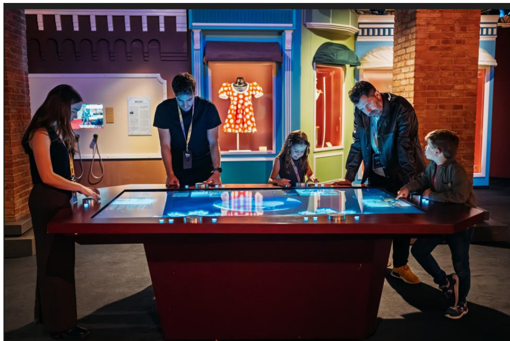
Un momento del recorrido en Disney: The Exhibition - 100 Años de Magia

Madrid, 23 de abril de 2026. – La Fundación Canal amplía sus dos exposiciones en curso hasta los meses de verano, gracias a la gran demanda de público. En concreto, la exposición Arte urbano. De los orígenes a Banksy se extenderá hasta el próximo 26 de julio, mientras que Disney: The Exhibition - 100 años de magia se prolongará hasta el próximo 5 de julio.