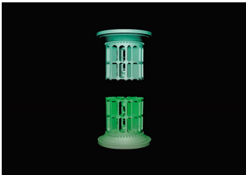
Volver a mirar , 2026. © Rosa Muñoz

La artista, con una sólida trayectoria nacional e internacional, que ha expuesto en destacadas instituciones culturales y ha participado en ferias de referencia a nivel mundial, plantea una reinterpretación contemporánea de este icono arquitectónico de Madrid , que vincula agua, entorno, arte y sostenibilidad.