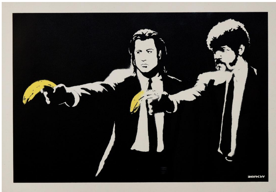
Banksy. Elige tu arma [Choose your weapon] , 2010. Serigrafía sobre papel.