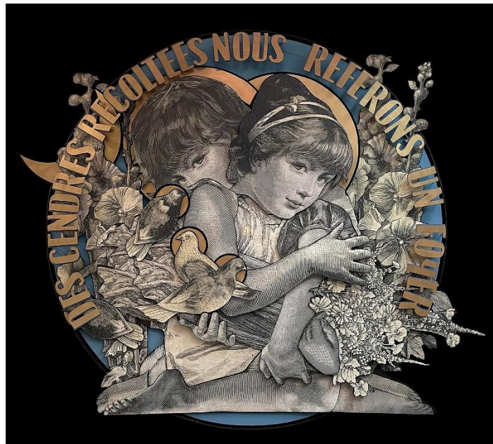
Madame. Hogar, 2022. Madera, metal y papel impreso.

En su llegada a Europa, con ciudades de fuerte carga histórica y cultural, el arte urbano incorporó nuevas técnicas y discursos: el uso del estencil, la intervención monumental, la poesía visual o la cita artística. La pared dejó de ser únicamente un espacio de confrontación para convertirse en un lugar de diálogo con la arquitectura, la memoria y la identidad colectiva.