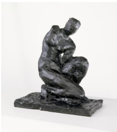
Henri Matisse. Venus agachada, 1918-1919.

Este repertorio de formas, que toma como base la estatuaria clásica, el arcaísmo griego o la escultura egipcia, entre otros, evolucionará a una escultura moderna, influida por artistas contemporáneos a Matisse, como Aristide Maillol o Auguste Rodin . La inspiración clásica se refleja de forma intercalada en diferentes etapas de su producción, como en el bronce Venus agachada (1918-1919).