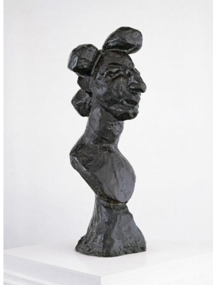
Henri Matisse. Jeannette IV, 1911