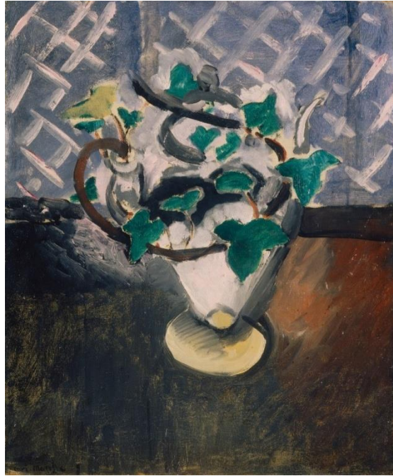
Henri Matisse. Rama de hiedra , 1916 © Succession H. Matisse/ VEGAP/ 2024

Exposición organizada por la Fundación Canal en colaboración con el Museo Matisse de Niza y el museo Kunsthaus Zürich y con el apoyo de Manifesto Expo