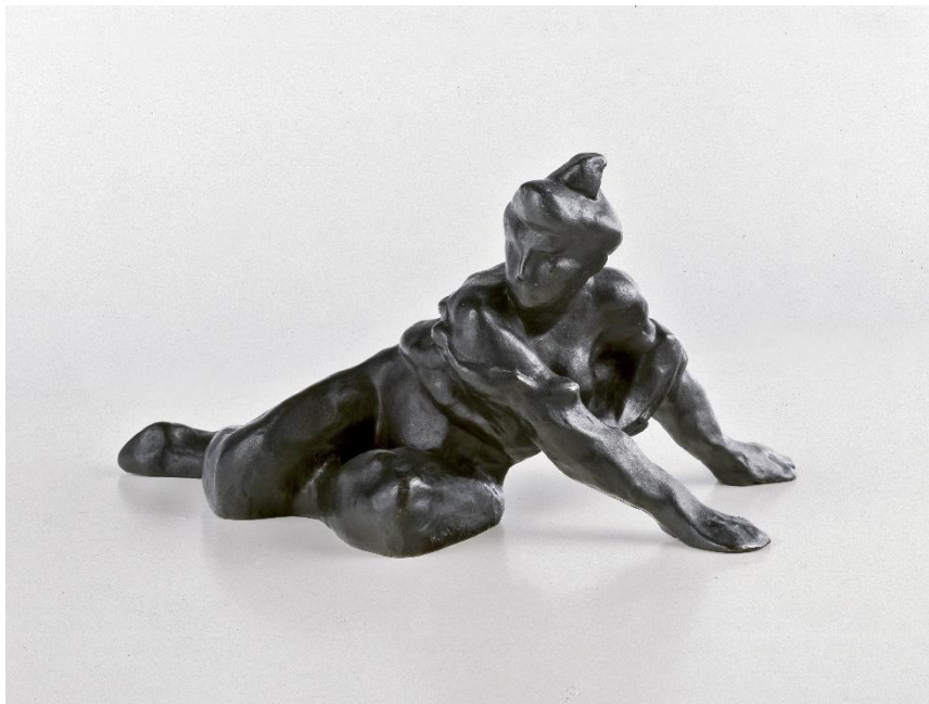
Henri Matisse, Desnudo apoyado sobre las manos , 1905. © Succession H. Matisse/VEGAP/ 2024

Madrid, 22 de octubre de 2024.- La Fundación Canal presenta Matisse Metamorfosis. Esculturas y dibujos , una exposición que aborda la importancia de la obra escultórica de Henri Matisse y su proceso creativo, en el que la representación de la figura humana y su evolución desempeñan un papel primordial.