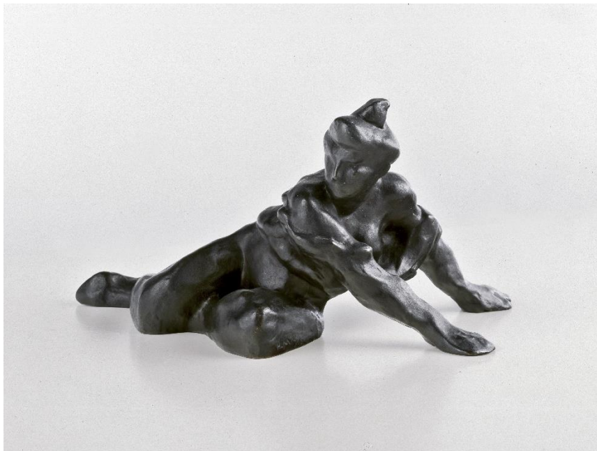
Henri Matisse, Desnudo apoyado sobre las manos , 1905. © Succession H. Matisse/ VEGAP/ 2024

Exposición organizada por la Fundación Canal en colaboración con el Museo Matisse de Niza y el museo Kunsthaus Zürich y con el apoyo de Manifesto Expo