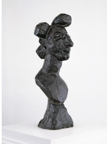
Henri Matisse. Jeannette IV, 1911