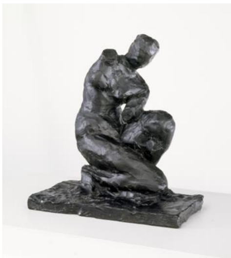
Henri Matisse. Venus agachada, 1918-1919.

Este repertorio de formas, que toma como base la estatuaria clásica, el arcaísmo griego o la escultura egipcia, entre otros, evolucionará a una escultura moderna, influida por artistas contemporáneos a Matisse, como Aristide Maillol o Auguste Rodin . La inspiración clásica se refleja de forma intercalada en diferentes etapas de su producción, como en el bronce Venus agachada (1918-1919).