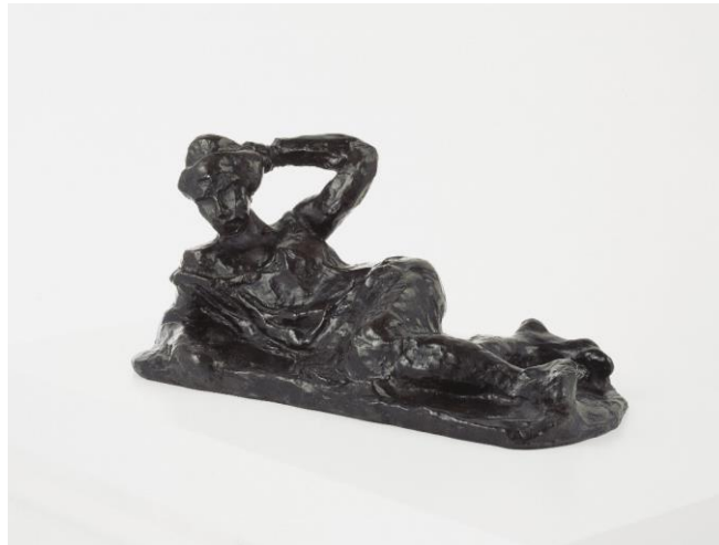
Henri Matisse. Desnudo recostado con camisa , 1906 © Succession H. Matisse/ VEGAP/ 2024

Al optar por figuras recostadas, Matisse podía explorar la curva natural de la espalda, la caída de las extremidades y la interacción entre el cuerpo y el espacio , todo con un enfoque en la armonía y la fluidez de la forma. Con Desnudo recostado con camisa (1906), Matisse retoma el motivo procedente de la escultura clásica de la Ariadna dormida.