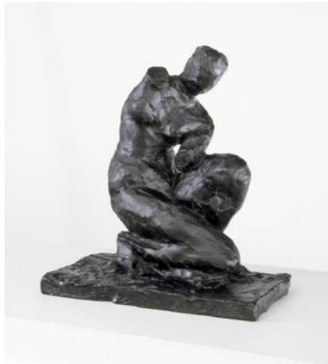
Henri Matisse. Venus agachada, 1918-1919.

Este repertorio de formas, que toma como base la estatuaria clásica, el arcaísmo griego o la escultura egipcia, entre otros, evolucionará a una escultura moderna, influida por artistas contemporáneos a Matisse, como Aristide Maillol o Auguste Rodin . La inspiración clásica se refleja de forma intercalada en diferentes etapas de su producción, como en el bronce Venus agachada (1918-1919).