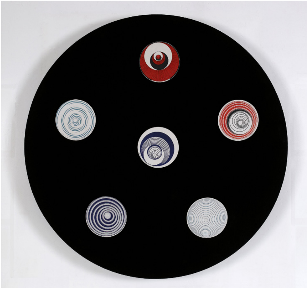
Marcel Duchamp. Rotoreliefs (Relieves de rotor). Discos ópticos. Concebidos en 1935. Ejemplar de 1965. 6 discos impresos en doble cara sobre un eje giratorio para discos inserto en una caja de madera recubierta de terciopelo negro. Colección Marion Meyer. Association Internationale Man Ray, París. © Association Marcel Duchamp. VEGAP, Madrid 2024.