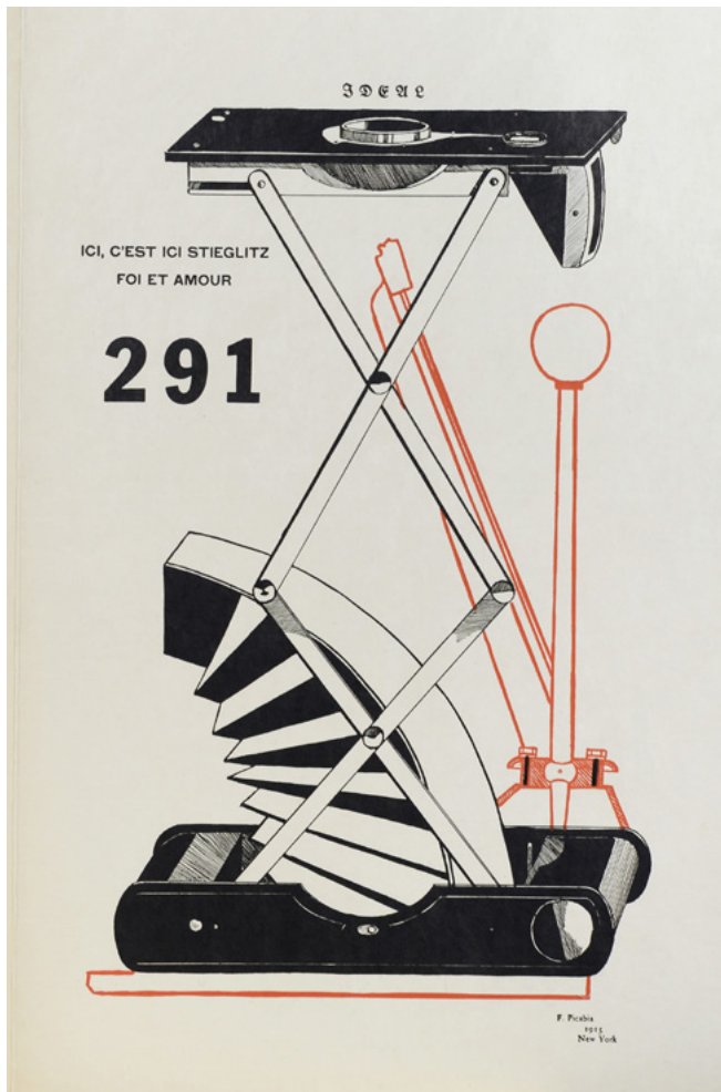
Revista 291, núm. 5-6. Julio y agosto 1915 En portada: Retrato de Alfred Stieglitz por Francis Picabia. Comité Picabia, París.