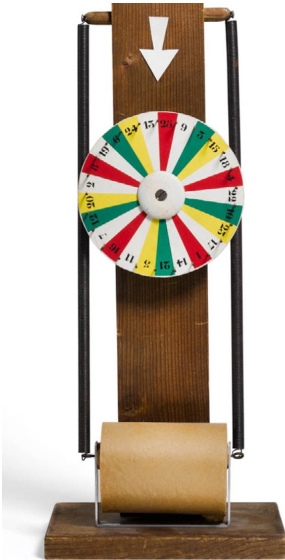
Man Ray. La fortuna III. 1946 / 1973 Madera, metal, cartón y papel higiénico Colección Galerie Hummel, Viena.