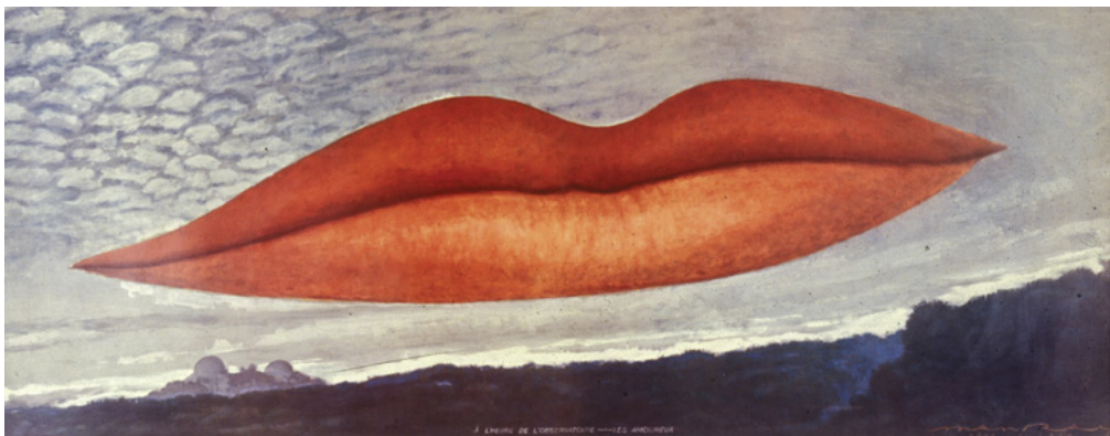
Man Ray. A la hora del observatorio / Los amantes, 1934 / 1967

En la siguiente sala podrá continuar sobre el tema y descubrir cómo los artistas parten del dibujo académico y en concreto del desnudo y comienzan a experimentar para transformarlo en otras cosas.