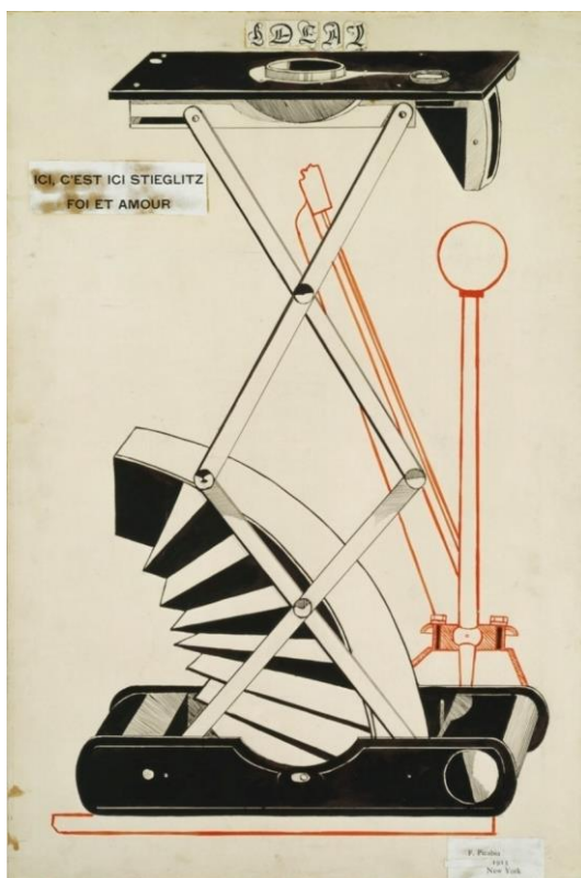
Retrato de Alfred Stieglitz por Francis Picabia, 1915.

Revista 291, núm. 5-6. En portada: Ici, c'est ici Stieglitz, Foi et amour (Aquí Stieglitz, fe y amor) Comitè Picabia, París. © Francis Picabia, VEGAP, Madrid, 2024