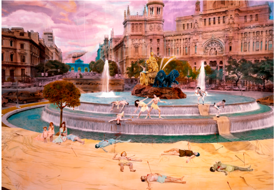
Ouka Leele. Rappelle-toi, Bárbara , 1987.