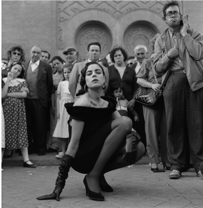
Alberto García Alix. Tarde de San Isidro , 1987.