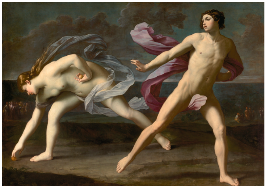
Guido Reni. Atalanta e Hipómenes , 1618-19.

Comenzamos dejándoles descubrir qué pasa en la imagen y hablar de los personajes que aparecen. Si en el aula han visto el video recordarán que se trata de una representación del mito clásico de Hipómenes y Atalanta en la que la artista nos cuenta quiénes son los leones que tiran del carro de Cibeles. Para ello se inspiró en una obra muy famosa del artista renacentista Guido Reni. La historia cuenta cómo la bella y rápida Atalanta solo se casaría con aquel de sus pretendientes que le ganara en una carrera, mientras que los que fueran vencidos morirían. Hipómenes pidió ayuda a la diosa Venus que le obsequió con las manzanas doradas del jardín de las Hespérides con las que conseguiría distraer a Atalanta para vencerla y casarse con ella finalmente. Según el mito Hipómenes y Atalanta fueron después convertidos en leones por la diosa Cibeles.