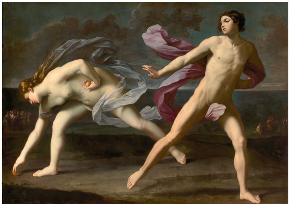
Guido Reni. Atalanta e Hipómenes , 1618-19.

Comenzamos dejándoles descubrir qué pasa en la imagen y hablar de los personajes que aparecen. Si en el aula han visto el video recordarán que se trata de una representación del mito clásico de Hipómenes y Atalanta en la que la artista nos cuenta quiénes son los leones que tiran del carro de Cibele. Para ello se inspiró en una obra muy famosa del artista renacentista Guido Reni. La historia cuenta cómo la bella y rápida Atalanta solo se casaría con aquel de sus pretendientes que le ganara en una carrera, mientras que los que fueran vencidos morirían. Hipómenes pidió ayuda a la diosa Venus que le obsequió con las manzanas doradas del jardín de las Hespérides con las que conseguiría distraer a Atalanta para vencerla y casarse con ella finalmente. Según el mito Hipómenes y Atalanta fueron después convertidos en leones por la diosa Cibele.