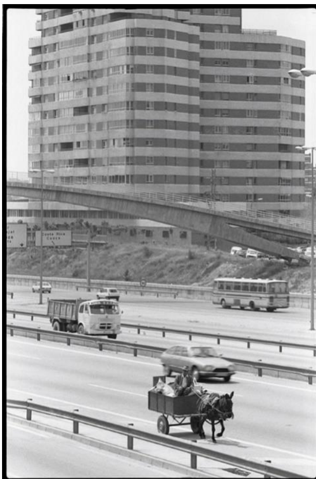
Javier Campano. Chamartín. © Javier Campano, VEGAP, Madrid, 2023

En esta sección se muestra la evolución de la comunidad de Madrid en sus 40 años de autonomía a través de datos, imágenes y gráficos que analizan el desarrollo de la población, a través del urbanismo, las infraestructuras, la movilidad, la salud, los servicios sociales, el medioambiente, la educación, la economía y el empleo.