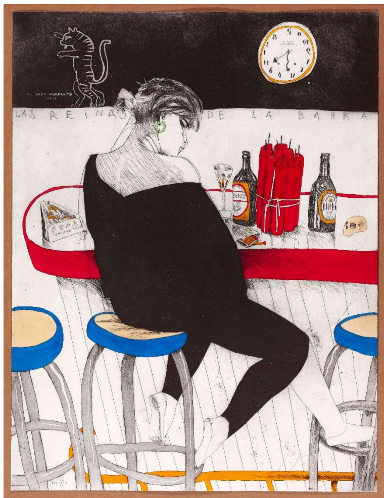
Javier de Juan. Las reinas de la barra, 1987. © Javier de Juan, VEGAP, Madrid, 2023

El papel fue uno de los soportes creativos más utilizados como recurso artístico y promocional en esta década. Revistas, fanzines, carteles o tarjetas postales se adecuaron a la perfección, a la vorágine creadora y al deseo de acercamiento a un público más amplio. Estos soportes tuvieron una difusión que se entretreía, como las redes artísticas de la época, en espacios no convencionales.