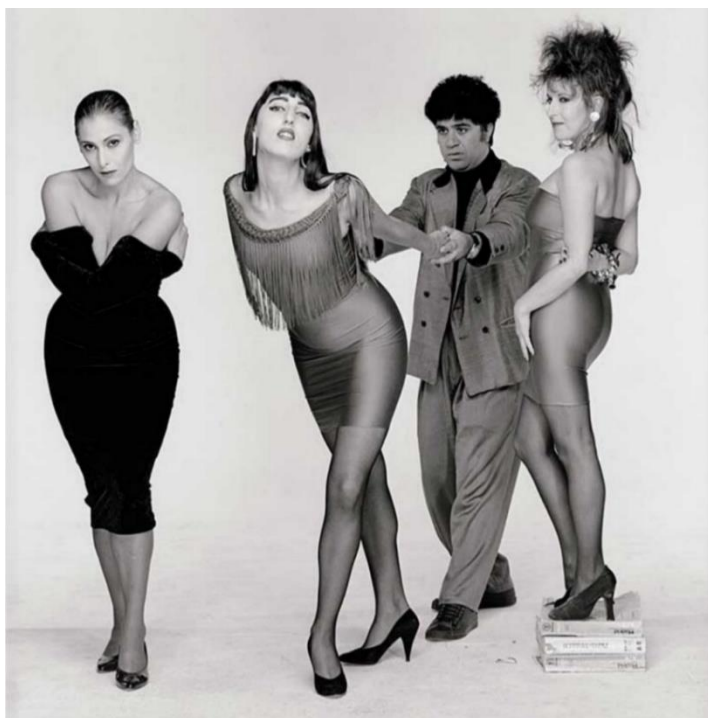
María Barranco, Rossy de Palma, Pedro Almodóvar y Loles León, 1988.

Acompañando a las fotografías de música y moda, el recorrido por la segunda estancia de la exposición se completa con un homenaje al cine de los 80 que tuvo un protagonista indiscutible: Madrid. Aquí se muestra una selección de 16 carteles de películas que definieron el cine español de la década, así como una breve galería de fotografías con fotos de rodaje y promocionales de las estrellas de los 80 como Almodóvar y su troupe al completo en diferentes momentos y rodajes o una jovencísima Emma Suárez.