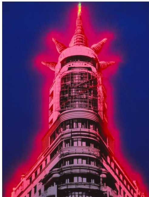
Juan Ramón Yuste. Capitol, 1982.

El apartado final de la exposición se titula “Pensar Madrid” y se centra en la aventura de “pensar” un nuevo Madrid para el futuro en el momento de abordar la creación de la nueva Comunidad Autónoma: los importantes cambios sociales, urbanísticos, estructurales, demográficos y de servicios públicos que debía afrontar la nueva región para consolidarse y prosperar. Comparativas que permiten comprender la transformación de la región en los últimos 40 años que manifiestan el impacto de un nuevo Madrid y en su población.