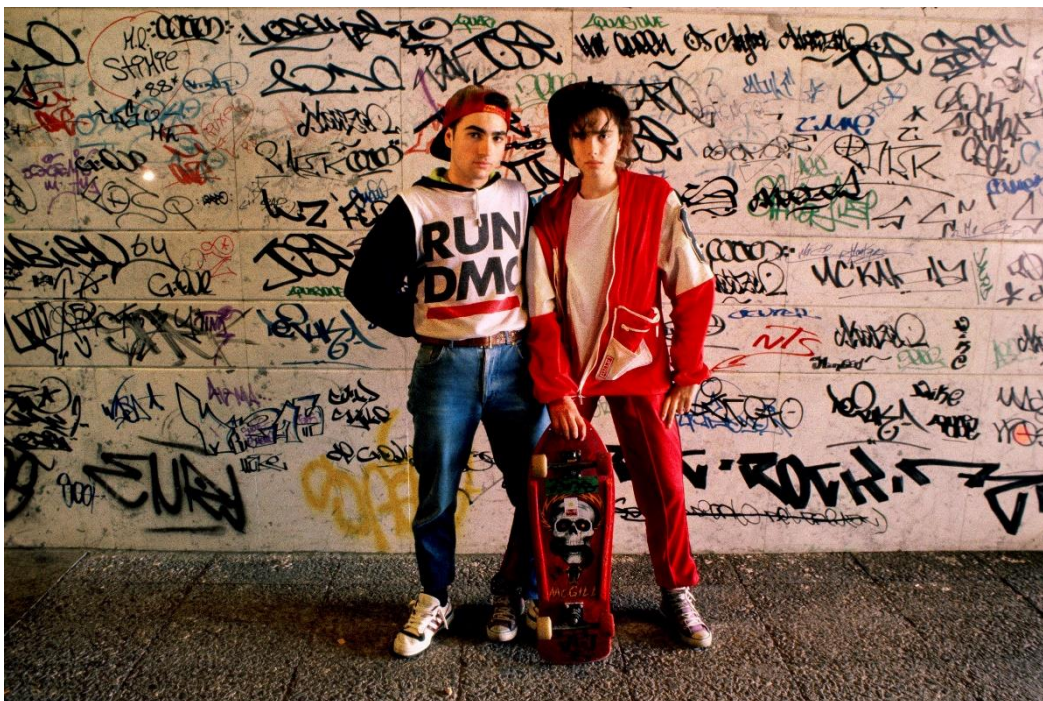
Miguel Trillo. Domingo en Azca, Nuevos Ministerios, 1989.

En este ámbito se muestra una selección de retratos y campañas de grandes nombres de la moda española de los 80 como Antonio Alvarado o Jesús del Pozo, acompañadas de una vitrina con una selección de joyas de Chus Burés, como la famosa arma/joya que diseñó para la película Matador de Pedro Almodovar en 1986. La parte dedicada a la moda se completa con un vídeo del mítico desfile de Francis Montesinos en Las Ventas en 1985 para el que congregó a más de 15.000 personas, algo inaudito hasta entonces.