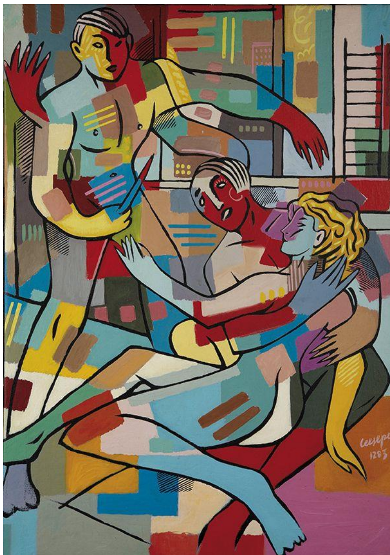
Ceesepe. Trapos sucios, 1983.