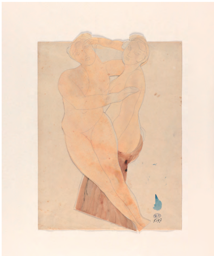
Dos mujeres abrazadas

Dibujo recortado