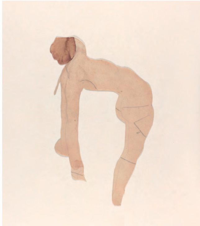
Mujer desnuda de perfil, sentada sobre sus talones, con un brazo extendido Dibujo recortado © musée Rodin (photo Jean de Calan)