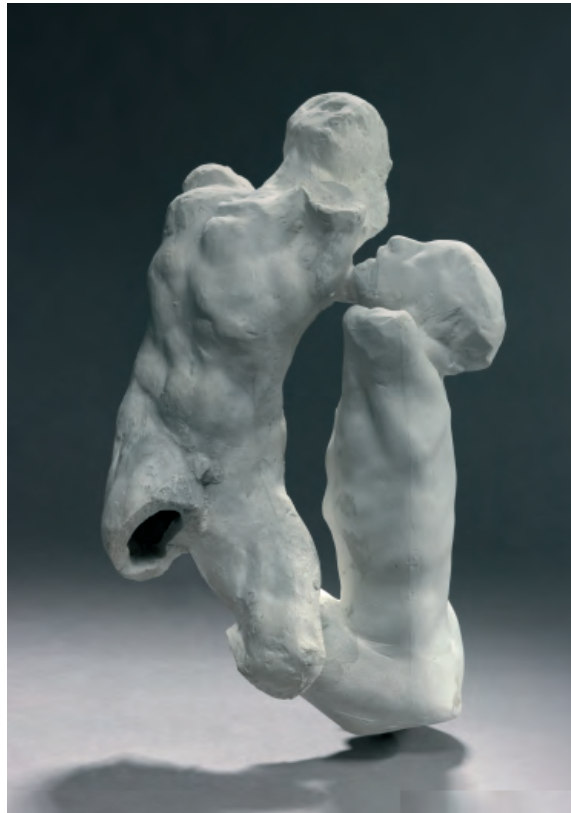
Dos torsos alargados

Escultura de yeso