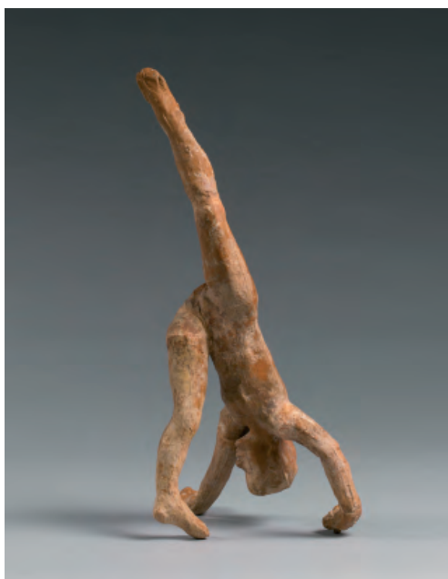
Movimiento de danza C

Escultura de terracota