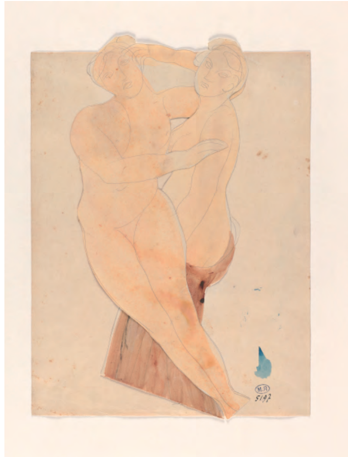
Dos mujeres abrazadas

Dibujo recortado