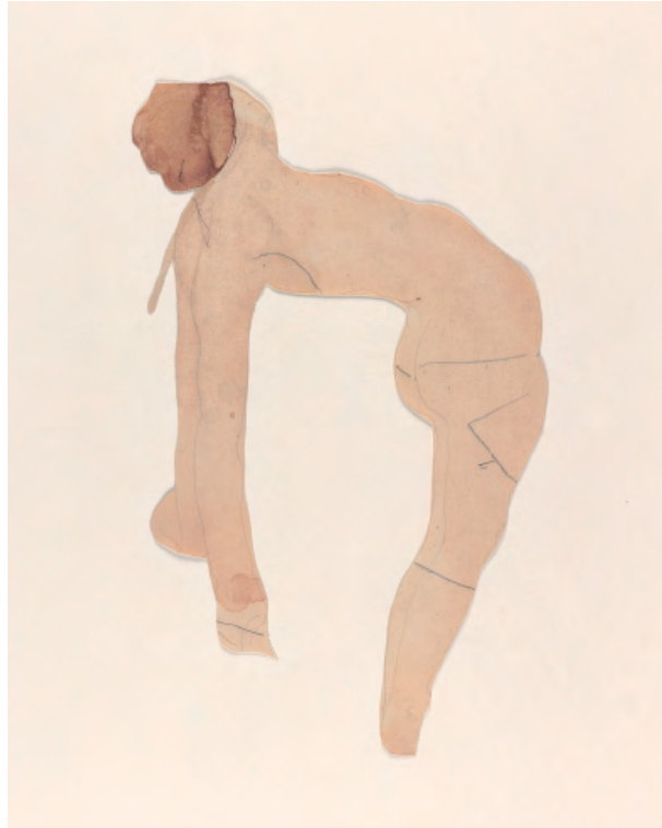
Mujer desnuda de perfil haciendo el puente Dibujo recortado © musée Rodin (photo Jean Calan)