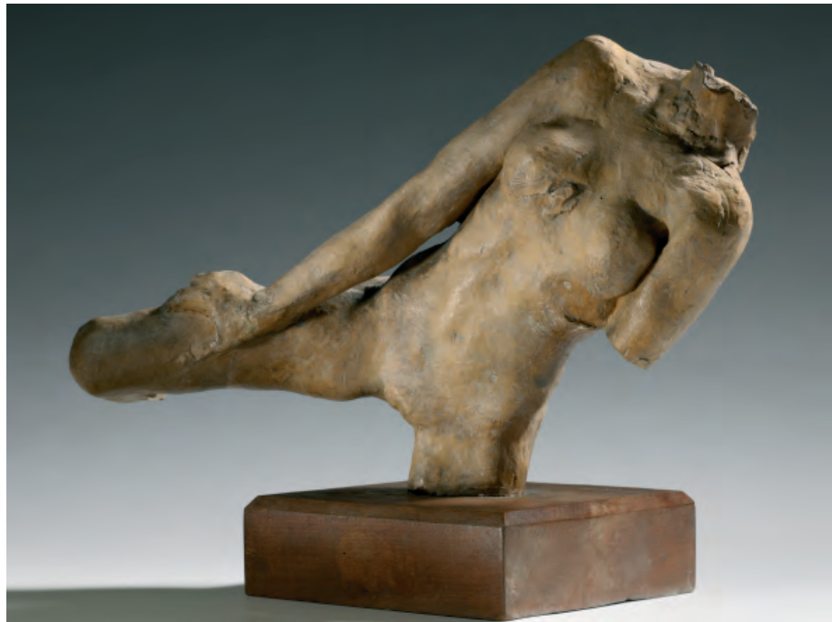
Figura volante, modelo pequeño Escultura de terracota