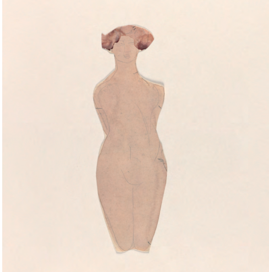
Mujer desnuda arrodillada, de frente, inclinada hacia delante y con las manos detrás de la espalda Dibujo