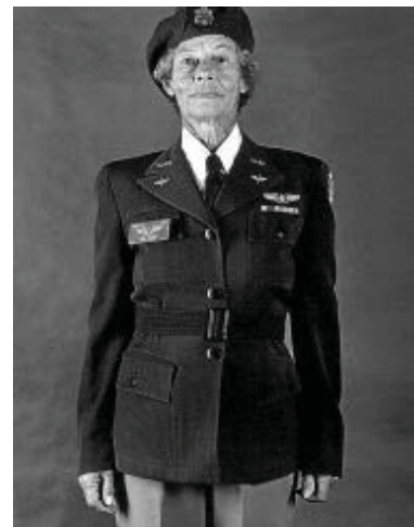
«LOIS HOLLINGSWORTH ZILNER, PILOTO DE LAS FUERZAS AÉREAS EN LA II GUERRA MUNDIAL» (1984), DE ANNE NOGGLE.

Un total de 130 instantáneas procedentes de la Colección George Eastman House invita a reflexionar sobre las diferencias entre ambos sexos, algunas de las cuales han creado estereotipos, como la que enfrenta la sensualidad y elegancia del cuerpo femenino a la fortaleza y vigor del masculino. Sin embargo, aunque en menor proporción, también es posible ver imágenes en las que los roles de género saltan por los aires y se establece un intercambio de papeles. Entre ambos polos, escenas que transmiten valentía, in-