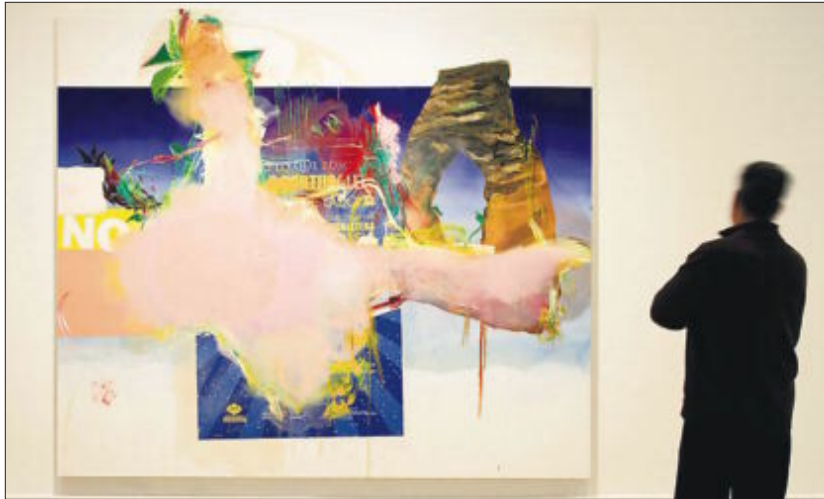
Uno de los cuadros de Albert Oehlen en La Casa Encendida.

que emergen ante un país inmerso en el limbo entre tradición y modernidad. En la misma institución se puede visitar paralelamente la colectiva comisariada por Iván López Munuera Pop Politics: Activismos a 33 revoluciones , una reflexión sobre la implicación política y social a través de la música pop y sus protagonistas: aquellos que la escuchan, la viven y la sienten.