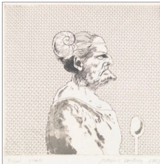
Grabado de David Hockney en la Fundación Canal.