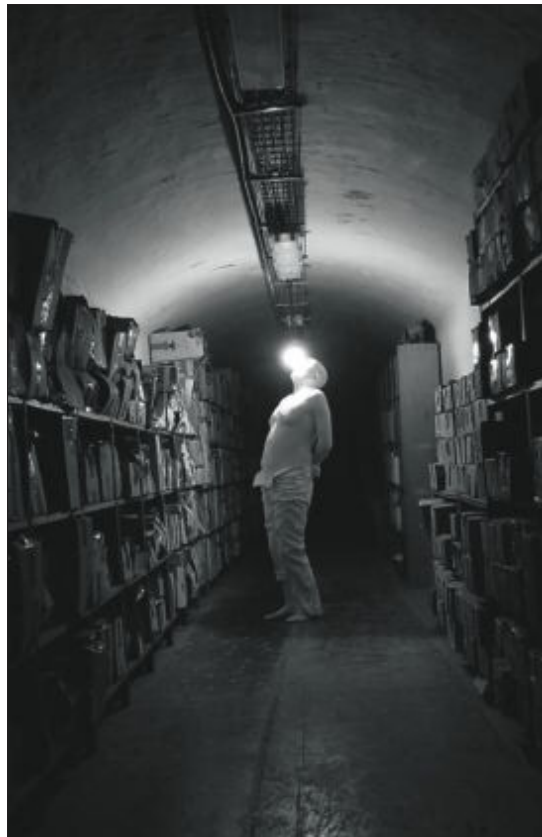
Practices to suck the world , de Bernardí Roig, en la Lázaro Galdiano.

» Halil Altindere, en el Centro de Arte 2 de Mayo. (Avenida de la Constitución, 23, Móstoles. Hasta el 3 de junio. Entrada libre). Por si Turquía no tenía suficiente protagonismo como país invitado en Arco, el CA2M presenta una muestra de uno de sus artistas más polifacéticos y efervescentes. A través de los más diversos medios y con los más variados pretextos, Altindere pinta en fotografías, esculpe en vídeos o dibuja en instalaciones las verdades y los prejuicios