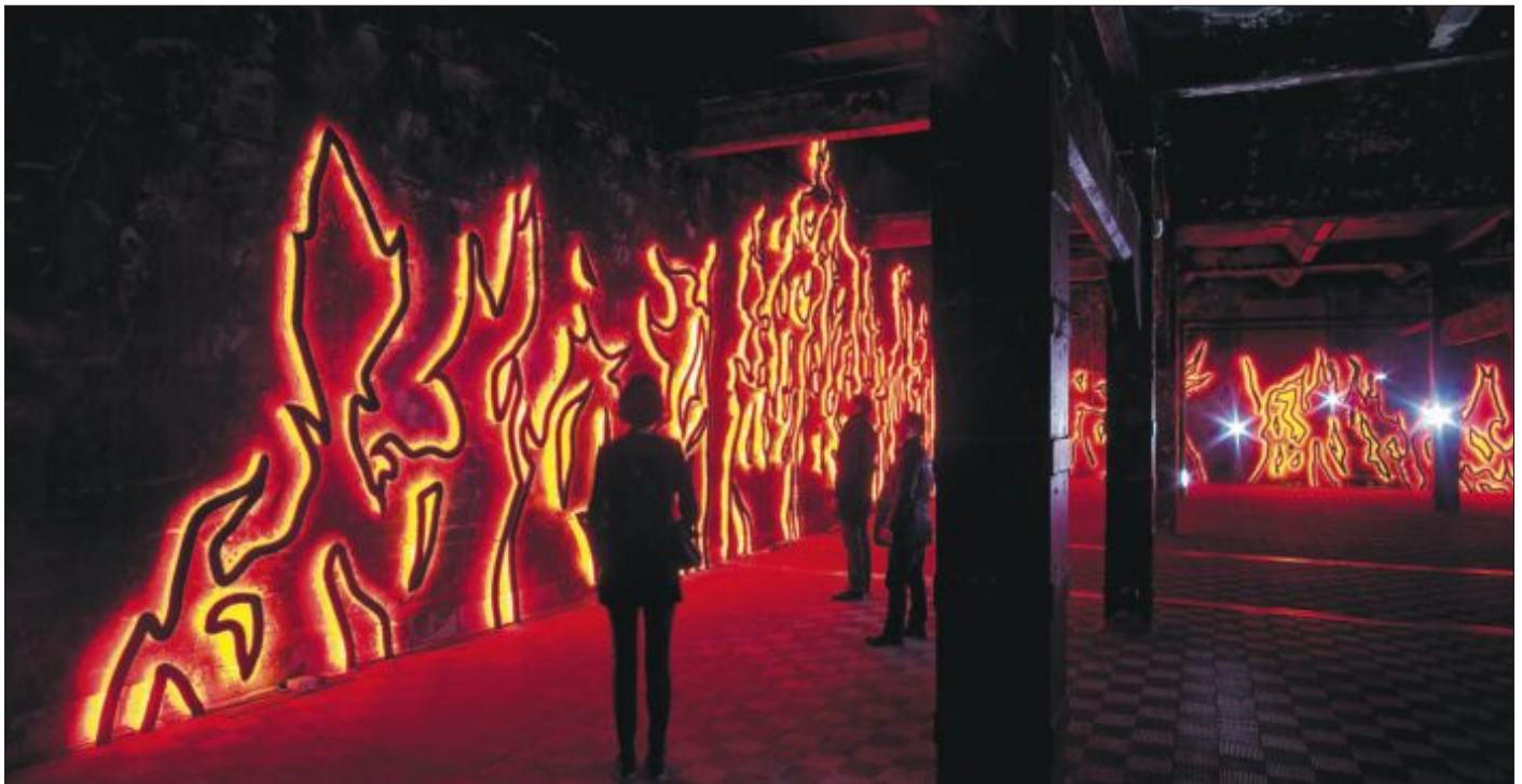
La escultura Candela es la gran atracción de la exposición del colectivo Los Carpinteros en Matadero.