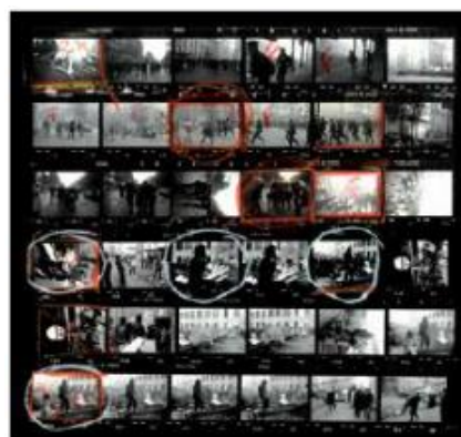
Protestas en París, Francia 1968

Madrid, 4 de octubre de 2017.- La Fundación Canal presenta a los medios su nueva exposición Magnum: Hojas de Contacto . Se trata de un recorrido único por 94 fotografías realizadas por 65 de los más destacados creadores de la mítica agencia Magnum Photos. Las imágenes se acompañan de sus correspondientes hojas de contacto lo que permite al visitante adentrarse en el proceso creativo de algunos de los más grandes fotoperiodistas de la historia y ser testigo directo de momentos clave de la historia reciente, del Desembarco de Normandía en la II Guerra Mundial a la caída de las Torres Gemelas de Nueva York el 11-S de 2001, pasando por conflictos como el de Vietnam o los Balcanes.