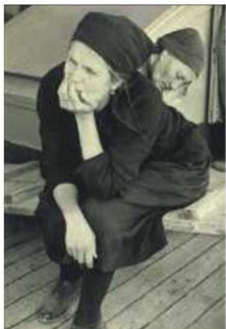
Ferry de Split a Tragir, de Marc Riboud.

Magnum's First. Hasta el 19 de enero de 2014. Fundación Canal. Mateo Inurria, 2. Entrada libre.