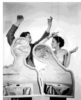
Cecil Beaton. Salvador y Gala Dalí , 1936 ©The Cecil Beaton Studio Archive at Sotheby's

A Beaton le gustaba situar a sus retratados en su ambiente de trabajo o con atributos relacionados con su profesión. Como es el caso de Salvador Dalí y Gala, fotografiados detrás de la obra de Dalí titulada Pareja con las cabezas llenas de nubes . También vemos el gusto de Beaton por utilizar espejos para realizar retratos dobles, algunos presentes en esta sección, como el del compositor Ígor Stravinski, los escritores André Malraux o Tom Wolfe.