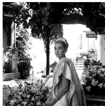
Cecil Beaton. Barbara Hutton, 1961.

En esta sección también encontramos los retratos de otras personalidades como como Jacqueline Kennedy, el torero Luis Miguel “Dominguín” o la estadounidense Barbara Hutton, considerada una de las mujeres más ricas del mundo. Heredera de los almacenes Woolworth, a Hutton la calificaban de “pobre niña rica”, debido a su inmensa riqueza y su problemática vida privada. Se casó y divorció siete veces y uno de sus maridos fue Cary Grant. Murió en la más absoluta pobreza expoliada por su entorno. Esta fotografía se tomó durante la estancia de Beaton en Tánger para asistir a un baile celebrado en Sidi Hosni, el palacio de Hutton. En ella, la estadounidense luce su famosa diadema de Cartier con esmeraldas que habían pertenecido a la Gran Duquesa Vladímir de Rusia.