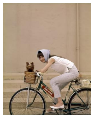
Audrey Hepburn, 1963

Este retrato muestra a Hepburn en el plató. Cuando ella vio las fotos de la sesión, escribió: “Desde que tengo memoria he deseado ser bella. Mientras miraba las fotografías anoche, me di cuenta de que lo fui durante un tiempo y fue gracias a ti”.