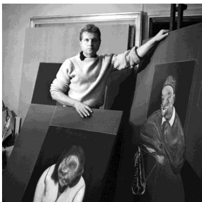
Cecil Beaton. Francis Bacon, 1960 ©The Cecil Beaton Studio Archive at Sotheby's

En cuanto a Francis Bacon, Beaton le describía como “un pintor brillante y devastador”. En 1957, el fotógrafo pidió a Bacon que le pintase y, tras una sesión infructuosa, lo intentaron de nuevo en 1960. En el ínterin, Beaton fotografió a Bacon en su estudio del barrio londinense de Battersea. Una vez el pintor terminó el retrato, Beaton lo encontró poco favorecedor: “Mi rostro apenas se reconocía, parecía desintegrarse ante los ojos del espectador”. Bacon terminaría destruyendo el retrato.