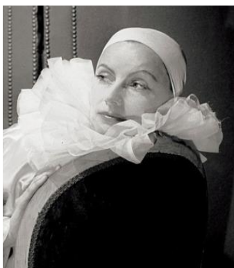
Cecil Beaton. Greta Garbo, 1946

Río, Johnny Weissmüller y muchos otros posaron para él. En esos años, Beaton utilizó los soportes de los decorados de los estudios como fondo de algunos de sus retratos, alejándose de los recargados escenarios de su primera etapa. En la exposición contamos con varios retratos en los que utiliza ese tipo de estructuras: los de Irving Berlin y Gary Cooper o el de Buster Keaton, cuyo fondo son dos escaleras de madera, que cobran casi más protagonismo que el propio retratado.