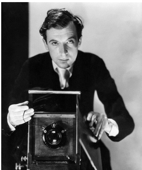
Cecil Beaton. Autorretrato , 1930

Además de producir un monumental corpus fotográfico, Beaton fue un talentoso dibujante y de su mano salieron notables ilustraciones y cuadros. Fue, además, escenógrafo y diseñador de vestuario para la gran pantalla y escritor; publicó 38 libros sobre fotografía y viajes, así como seis volúmenes de diarios.