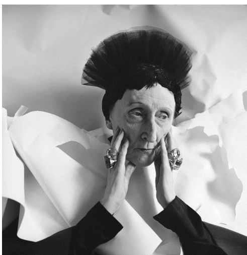
Cecil Beaton. Edith Sitwell, 1962. ©The Cecil Beaton Studio Archive at Sotheby's

Beaton comenzó su carrera fotográfica en casa de sus padres, donde creó un estudio provisional. Pronto llegó a su vida Edith Sitwell, poetisa de vanguardia y hermana de Osbert y Sacheverell, que se convirtió en una de sus modelos más frecuentes. Los Sitwell eran muy influyentes y su patrocinio fue muy importante para el lanzamiento de la carrera del fotógrafo.