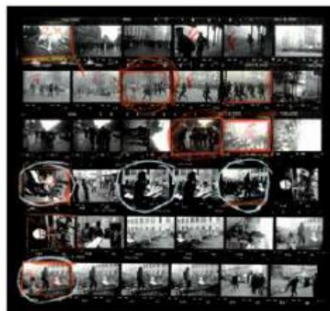
Protestas en París, Francia 1968