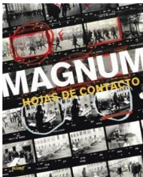
Imagen portada libro: Protestas en París, Francia 1968 (hoja de contactos)

Esta obra, por tanto, profundiza en el objetivo de la exposición de mostrar la manera en que los más destacados fotógrafos de Magnum Photos toman y editan sus mejores fotografías.