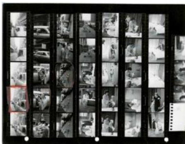
Una llama en Times Square, Nueva York, EE.UU., 1957

Las hojas de contacto aportan una valiosísima información, no sólo para el fotógrafo, sino también para los editores gráficos y las publicaciones a la hora de evaluar las tomas y elegir las mejores. Como herramienta de trabajo que son, su observación ha estado tradicionalmente limitada a estos colectivos profesionales. Sin embargo, por las posibilidades que ofrecen para adentrarse en el trabajo de los grandes fotógrafos y analizar las claves por las que consiguen que sus imágenes trasciendan su función informativa y se conviertan en icónicas, las hojas de contacto se han convertido en un objeto de culto para cualquier aficionado a la fotografía. Un culto incrementado en la actualidad cuando el paso del tiempo y la imposición de la fotografía digital, ha quitado a las hojas de contacto la consideración de herramientas de trabajo para otorgarles el de documentos históricos y convertirlas en el mejor exponente de la época dorada del periodismo gráfico, cuando eran el nexo de unión entre el fotógrafo, el editor, la agencia y las revistas.