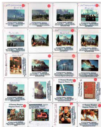
11-S. Nueva York. Septiembre 2001