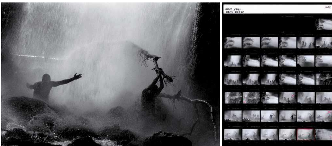
Saut d'Eau. Mirebalais, Haití. Julio 2002

Ya en los 2000 la fotografía digital empezaba a imponerse y, por tanto, las hojas de contacto pasan a convertirse en una reliquia del pasado que aún pervive en el trabajo de algunos fotoperiodistas como es el caso de los presentes en la muestra: Christopher Anderson, Jacob Aue Sobol, Jonas Bendiksen, Thomas Dworzak, Trent Parke, Paolo Pellegrin, David Alan Harvey, Thomas Hoepker, Cristina García Rodero, Alec Soth, Donovan Wylie, Marc Power, Mikhael Subotzky y Jim Godberg.