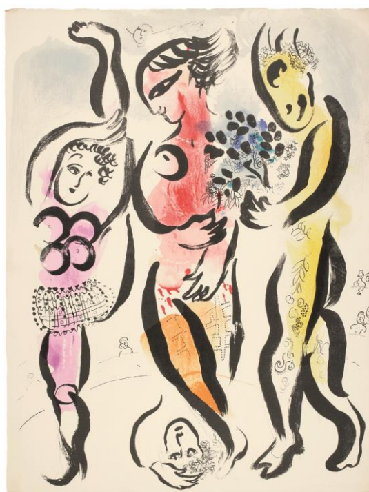
Los tres acróbatas , 1957 © VEGAP, Madrid, 2016. - Chagall ©

Presentación a medios: 3 de febrero de 2016