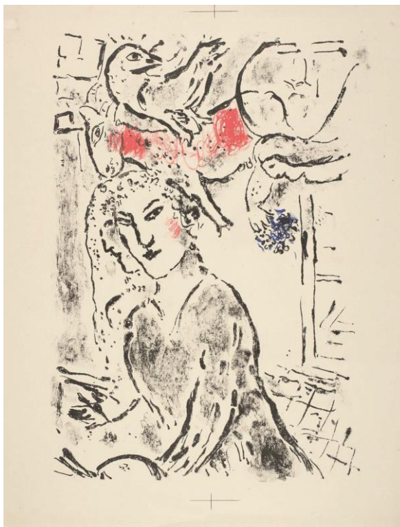
Autorretrato en la ventana, 1957 © VEGAP, Madrid, 2016 - Chagall®

En el Autorretrato en la ventana (1957), que recibe al visitante al entrar en la exposición, se observan varios elementos formales y motivos que caracterizan también los autorretratos. La paleta y el pincel son los atributos inconfundibles del pintor, cuyo perfil se funde con el de la amada esposa como una antigua representación de Jano. Una figura angélica femenina, un pájaro y un buey planean por encima del artista, la ventana del atelier está abierta y en la lógica de la pintura estas figuras de la realidad empírica parecen penetrar en la intimidad del estudio.