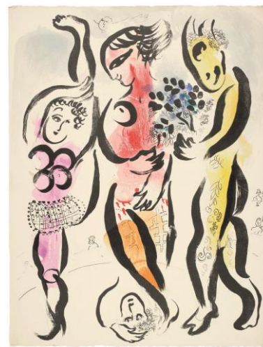
Los tres acróbatas, 1957 © VEGAP, Madrid, 2016 - Chagall®

Junto a estos dos temas destaca también en esta sección el de los personajes circenses. Chagall asemeja la profesión de acróbatas, payasos y otros protagonistas del circo con la suya de artista. Éstos realizan juegos de habilidad y de equilibrio en la escena del circo, de la misma manera que lo hace él en la escena de la pintura. Según Chagall, detrás de la alegría y la comicidad de los actores circenses se oculta la profundidad existencial del arte por excelencia. Así lo afirma el artista en una ocasión: “Siempre he considerado a los payasos, los acróbatas y los actores como la esencia de la humanidad trágica. Creo que se pueden comparar con los personajes de algunas pinturas religiosas”. Esta declaración de Chagall evidencia una vez más la profunda interrelación de lo sagrado y lo profano en su pensamiento artístico general.