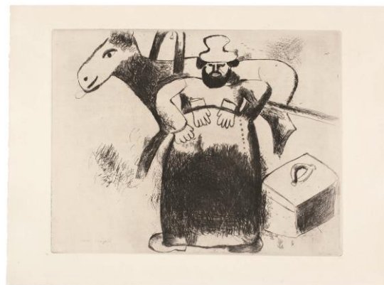
Las almas muertas, 1948 © VEGAP, Madrid, 2016 - Chagall®

Este apartado de la exposición incluye 15 obras relativas a la famosa novela. En sus aguafuertes Chagall evoca, desde lejos y con afecto, la patria rusa. La acidez y la irracionalidad son plasmadas a la perfección en estas obras, en las que se puede apreciar cómo Chagall supo interpretar magistralmente la sátira de Gógol y la descripción de sus inolvidables personajes. La gente del pueblo con la que se encuentra el protagonista Chíchikov es caricaturizada grotesca y magistralmente por el artista.