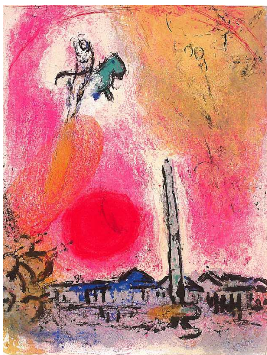
Place de la Concorde (Vistas de París) , 1960 © VEGAP, Madrid, 2016. - Chagall ©