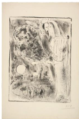
David y Betsabé, 1952 © VEGAP, Madrid, 2016 - Chagall®

la ciudad y se sirve de famosos edificios parisinos para hacer representaciones de la Virgen o del crucifijo.