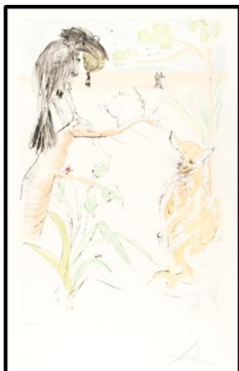
Salvador Dalí. Fábula sobre El cuervo y la zorra .

Dalí nos ofrece una serie de doce fábulas elaborada a la punta seca y aguafuerte siguiendo a Jean de La Fontaine y tomando su fuente en el fabulista griego Esopo. El título que recoge las láminas viene a ser: El Bestiaire de La Fontaine Dalinisé .