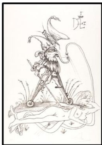
Salvador Dalí. Representación de la moral de Pantagruel, como imagen del rey Enrique II de Francia.

Las veinticinco láminas que componen esta serie litográfica que gestara el artista catalán remiten, a manera de seres monstruosos, a las aventuras burlescas de Pantagruel . Los modelos, por muy extraños que nos parezca, tienen su precedente en las llamadas drolerías , es decir, caprichos del artista.