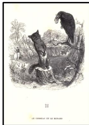
Fábulas de La Fontaine. Edición 1855. Jean Granville. El cuervo y la zorra . L.I,fab.II.

El cuervo y la zorra que nos presenta Dalí debe mucho en su composición al maestro francés pues incluso se da cuerpo a las dos figuras humanas que Grandville representa.