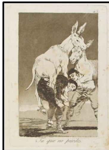
Francisco de Goya. Los Caprichos. Tú que no puedes. Lám. 42