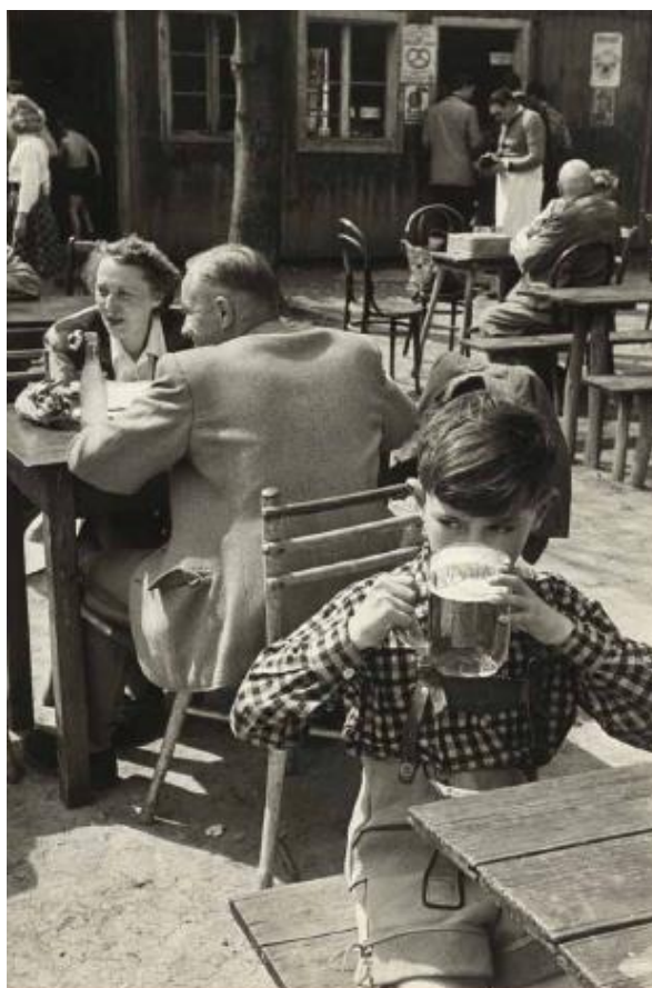
Wienerwald, Austria, 1954.

Presentación a medios: 22 de octubre de 2013.