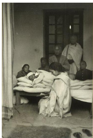
Gandhi el día antes de su asesinato Birla House, Delhi, India, 1948.

Este reportaje de Cartier-Bresson constituyó el cuerpo central de la exposición. En él muestra las dieciocho fotografías de su legendario portfollio “Gandhi”, realizado en 1948, y que muchos expertos consideran la obra cumbre del fotoperiodismo mundial. En él, el artista se ubica con su Leica telemétrica en el epicentro de las multitudes narrando fielmente los últimos días de vida y el funeral de Gandhi. La secuencia fotográfica no puede ser más completa: la víspera de su asesinato, el anuncio de su muerte por el Primer Ministro Nehru, el pueblo durante el cortejo fúnebre, su cremación y el dolor de sus miles de seguidores mientras observan el esparcimiento de sus cenizas en el río Summa.