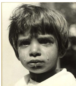
Hajduhadhaza, Hungría, 1947.

Una serie considerada unánimamente como una de las mejores en la historia del fotoperiodismo mundial. Bischof, un grandísimo fotógrafo con profundos conocimientos artísticos, elige siete fotografías muy variadas y diametralmente opuestas de sus viajes alrededor del mundo en los años cincuenta: niños peruanos, poblados andinos, un templo de Tokyo, escenas de la vida en Camboya, una bailarina de Bombay o un estanque japonés. Dos de las fotografías de la serie se han convertido en iconos de la historia de la fotografía, como ésta del niño húngaro llorando o el flautista solitario de los Andes.