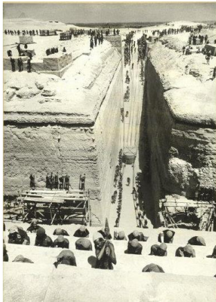
Rodaje de Tierra de Faraones, Egipto, 1954

La serie consiste en un reportaje del rodaje de la superproducción hollywoodense Tierra de faraones , estrenada en 1955. El director Howard Hawks pensó inicialmente en Capa, quien rechazó el encargo. Las fotografías corresponden a la época de sus inicios profesionales, y Haas deja su particularísimo sello intentando plasmar con la mayor verosimilitud posible la esencia del antiguo Egipto, verificando la máxima de que mediante la fotografía puede revelarse todo un universo dentro de un universo a través de una abstracción de ideas . Haas practicaba la fotografía rompiendo casi todas las normas académicas: disparaba contra el sol y fuera de foco para jugar con los reflejos y las texturas, y aunque ejerció la fotografía documental, en cada toma hay una interpretación personal.