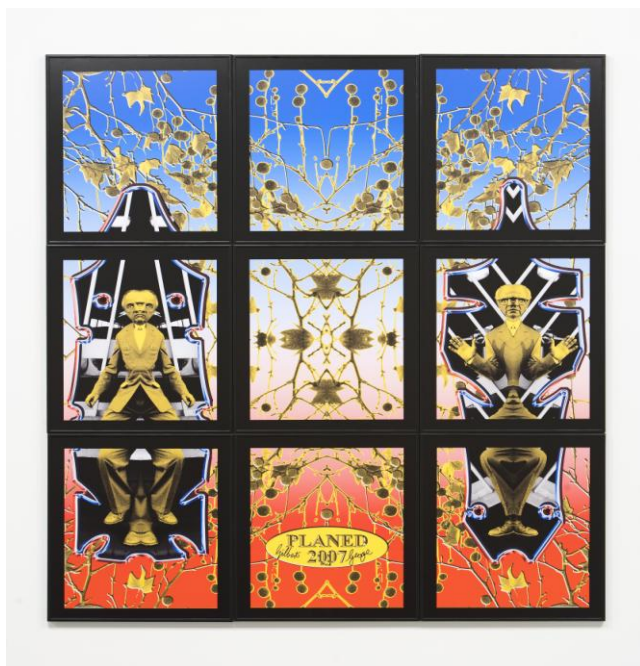
Planed. Gilbert & George