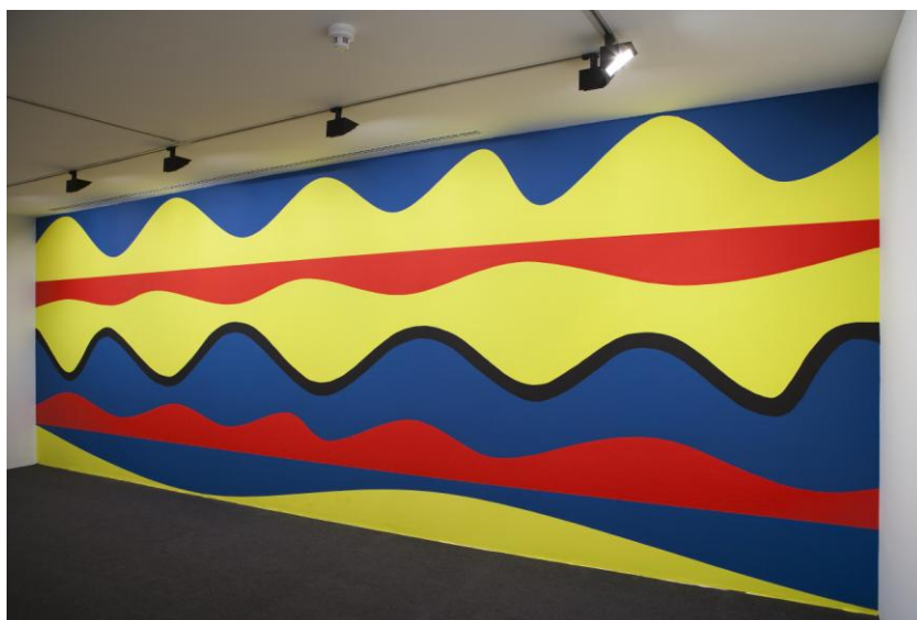
Wall Drawing nr. 989. Sol Lewitt

El escultor y pintor estadounidense Sol Lewitt (1928-2007) es uno de los máximos exponentes del arte conceptual del siglo XX.