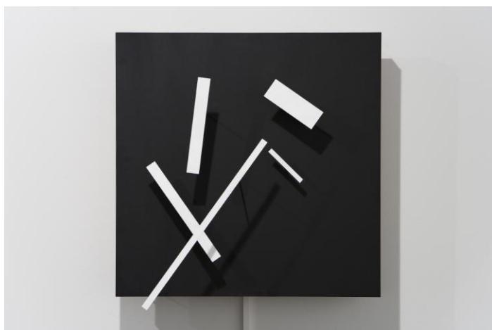
Meta Malevich. Jean Tinguely © Ignacio Hernando. Fundación Canal

La obra del escultor y pintor suizo Jean Tinguely (1925-1991), máximo exponente del arte cinético del siglo XX. La creación de Tinguely tiene un marcado carácter lúdico, bromista y estrambótico. Tinguely jugó a menudo a involucrar al espectador (personajes anónimos o artistas renombrados) en la producción de su obra. Fascinado por las máquinas, creó artefactos mecánicos capaces de crear, a su vez, obras de arte que el propio Tinguely firmaba y autentificaba como propias.