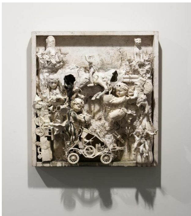
Shooting painting Niki de Saint Phalle

El énfasis en el gesto violento de la pintura abstracta de la postguerra alcanza su cénit con las Shooting Pictures de Niki de Saint Phalle.