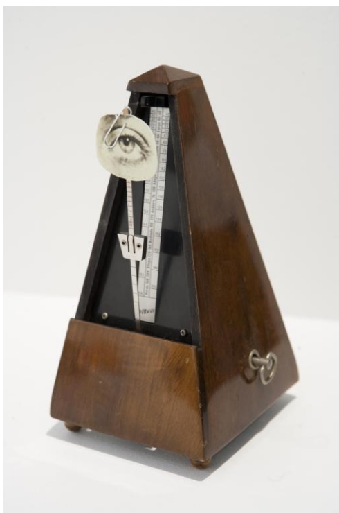
Object of destruction. Man Ray © Ignacio Hernando

Objeto de destrucción es una de las obras icónicas del estadounidense Man Ray, impulsor del Dadaísmo y el Surrealismo. La pieza consiste en un metrónomo con la fotografía de un ojo sujeta a su péndulo.