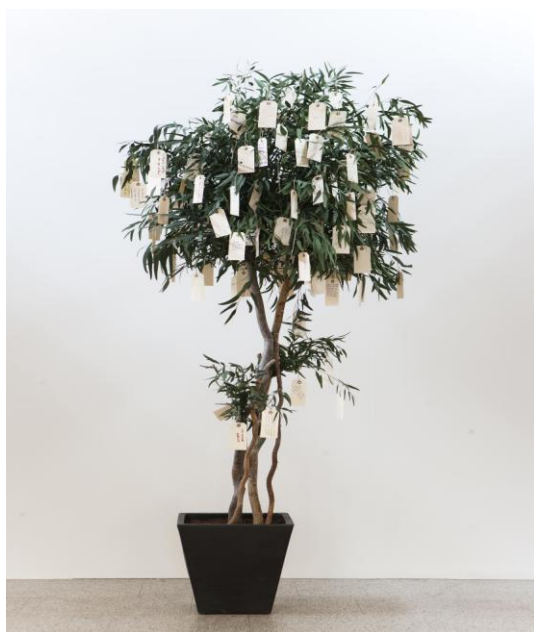
Wish Piece. Yoko Ono

“Cuando era una niña en Japón, solía ir a un templo y escribir un deseo en una tira de papel y colgarla de la rama de un árbol. Los árboles de los patios del templo estaban siempre repletos de los deseos de la gente, asemejando desde la distancia flores blancas en brote”, escribió la artista japonesa Yoko Ono, representante del arte conceptual de los años sesenta del siglo XX y miembro del grupo Fluxus.