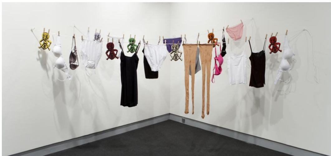
Sheela (Na-Gig) al home. Nancy Spero © Ignacio Hernando. Fundación Canal

Ropa, cuerda e impresión digital sobre papel