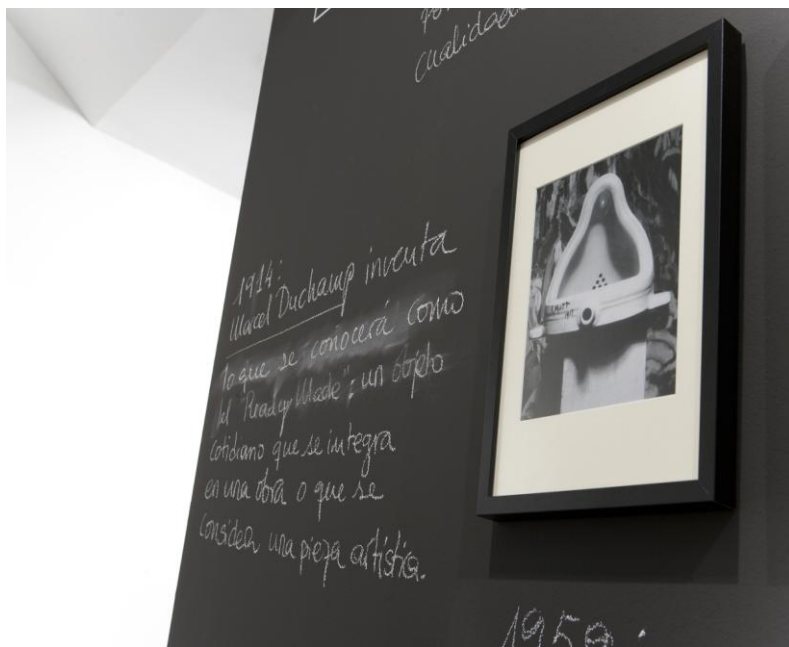
Montaje en sala. Cronograma. Fotografía de Fountain. Marcel Duchamp

Objeto de destrucción , de Man Ray, comentada más arriba, es también un ejemplo destacado del ready-made, además de un exponente del más puro Do-It-Yourself Art.