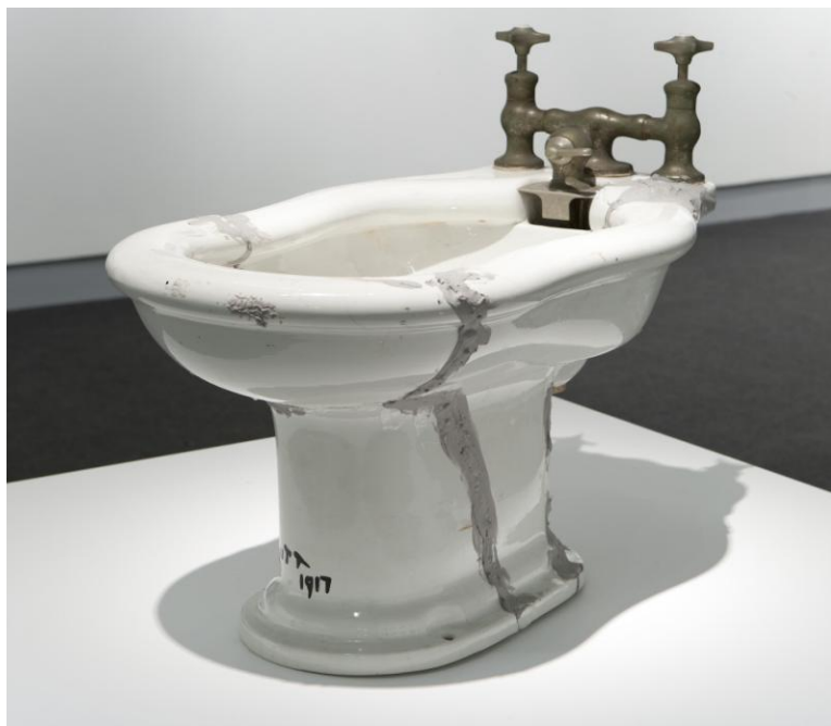
Anónimo. The Broken Rose Sélavy 2011

Esta sección de la exposición se ilustra con la representación del famoso urinario que Duchamp firmó como R. Mott y tituló Fuente en 1917.