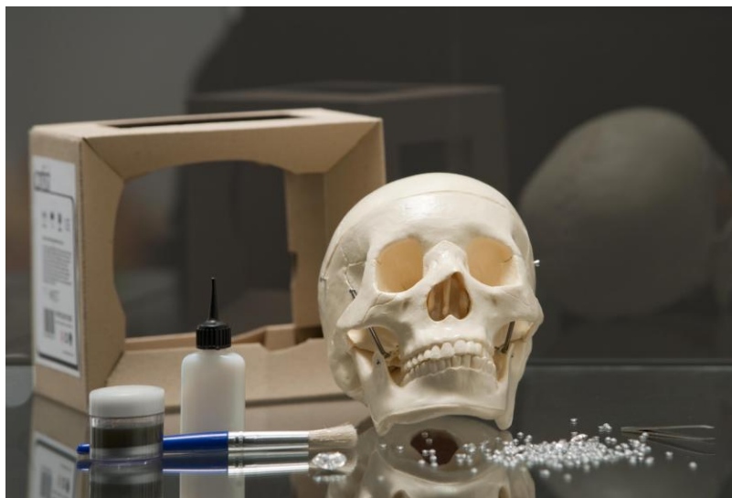
iHirst. Naroa Lizar © Ignacio Hernando. Fundación Canal

- iHirst. Calavera de plástico, cuentas de cristal, pegamento, pincel, pinzas, pintura plateada y manual de instrucciones