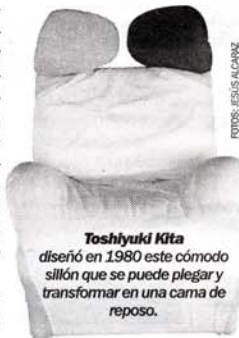
Toshiyuki Kita diseñó en 1980 este cómodo sillón que se puede plegar y transformar en una cama de reposo.

der Rohe, Joe Colombo o Shigeru Ban son algunos de los profesionales del diseño y la arquitectura que, desde el siglo XX hasta nuestros días, han investigado la forma de crear modelos de habitabilidad adaptados al estilo de vida de la sociedad, facilitándola y aportando una mayor comodidad a las personas. Pero esto es algo que se lleva haciendo desde el