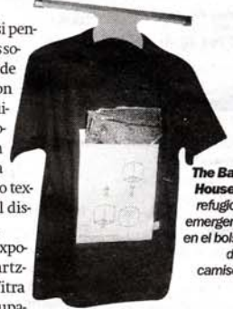
The Basic House , un refugio de emergencia en el bolsillo de la camiseta.

El comisario de esta exposición, Mathias Schwartz-Claus, del prestigioso Vitra Museum alemán, ha agrupado los diferentes diseños según sus características en cuanto a montaje, transporte, plegado para conseguir el ahorro de espacios, las posibilidades de combinación de los diseños, su adaptabilidad o facilidad para cambiar de forma y, por último, los accesorios que llevamos encima y que facilitan la movilidad de la persona. Es en este área temática de la exhibición donde