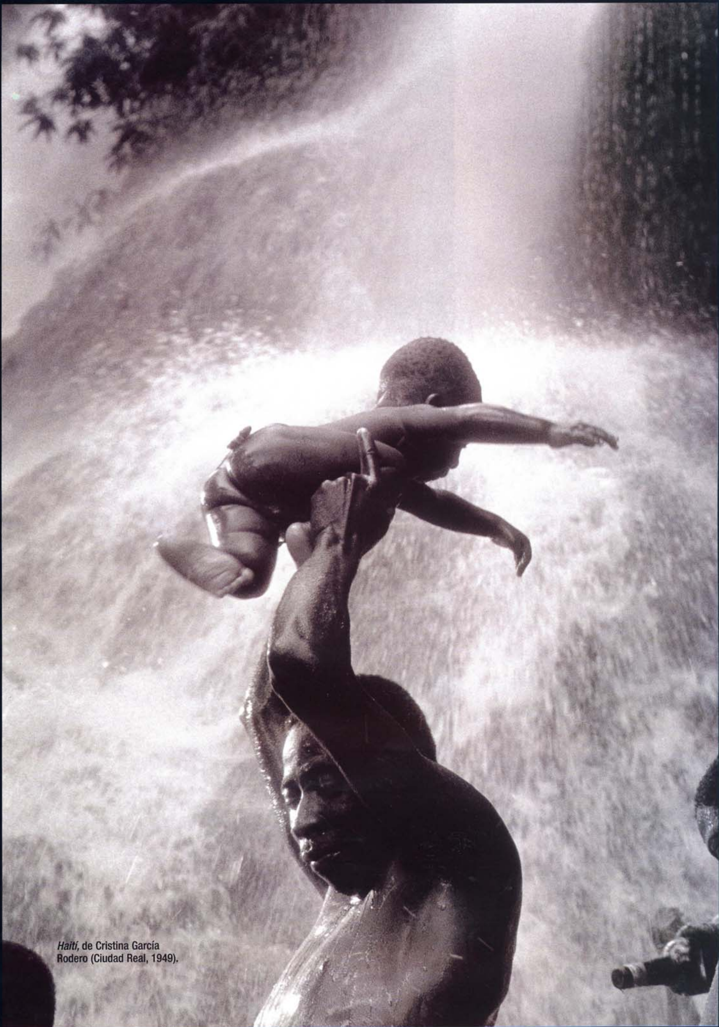
Haití , de Cristina García Rodero (Ciudad Real, 1949).