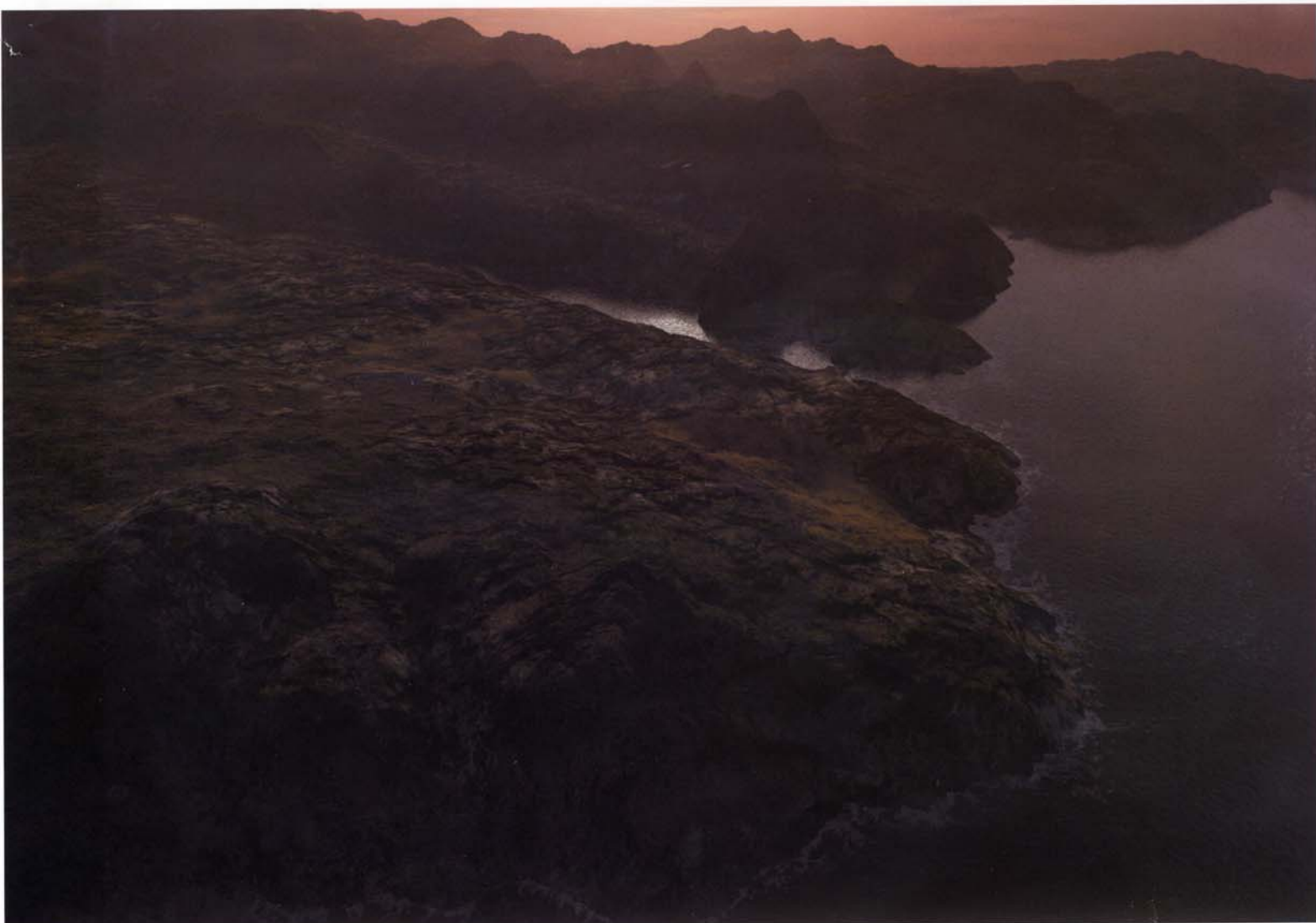
El Ejido 2004 , de Carlos Pérez Siquier (Almería, 1930). Debajo, Sin título , de Joan Fontcuberta (Barcelona, 1955).

Doce prestigiosos artistas españoles contemporáneos, once de los cuales son referencias incuestionables, y el duodécimo, un joven talento, ponen nombre y apellidos a Agua al desnudo