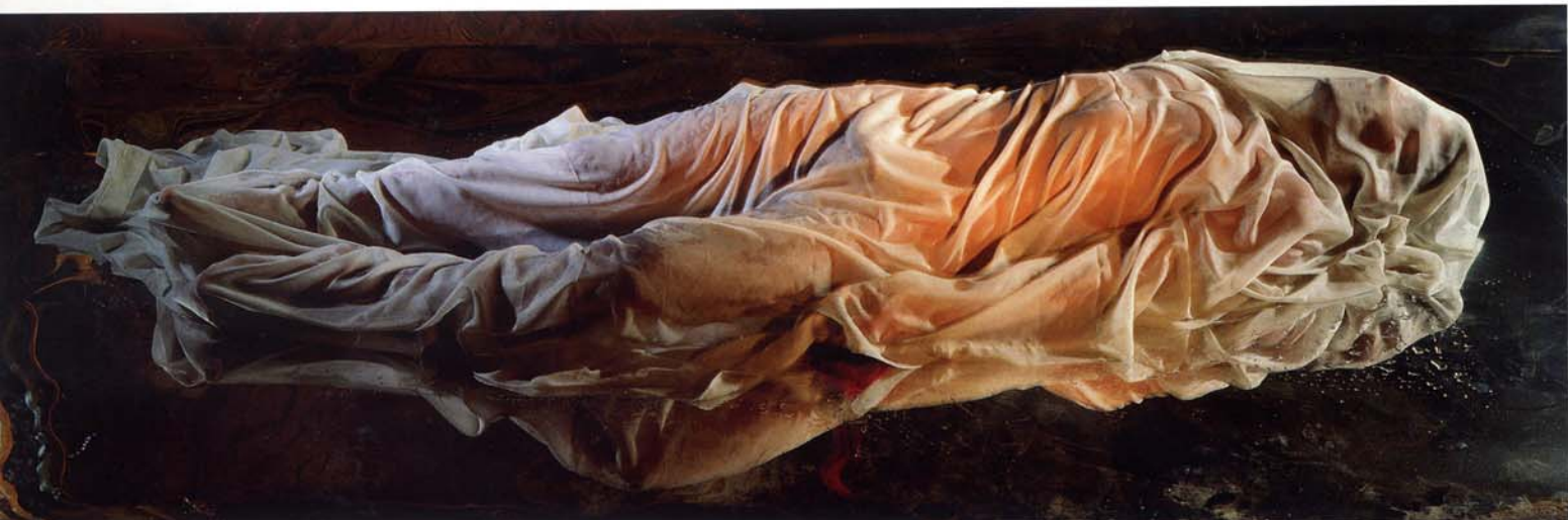
Homevelat , de Toni Catany (Mallorca, 1942).

un paso más en su investigación de las posibilidades artísticas del agua.