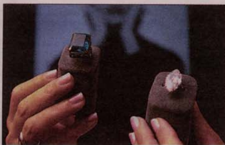
QUÉ: Muestra de joyas de la colección personal de la cantante María Callas DÓNDE: En la sede de Morgan Stanley, Serrano, 55 INTERÉS: Para clientes de la casa de subastas Sotheby's