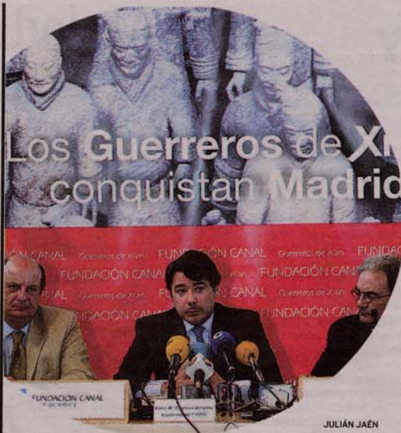
QUÉ: Los 'Guerreros de Xian' se mostrarán en Madrid durante casi dos meses CUÁNDO: Del 4 de noviembre al 9 de enero DÓNDE: En el nuevo centro Cuarto Depósito

«Posiblemente, al enamorado marido todo le parecía poco para la diva».