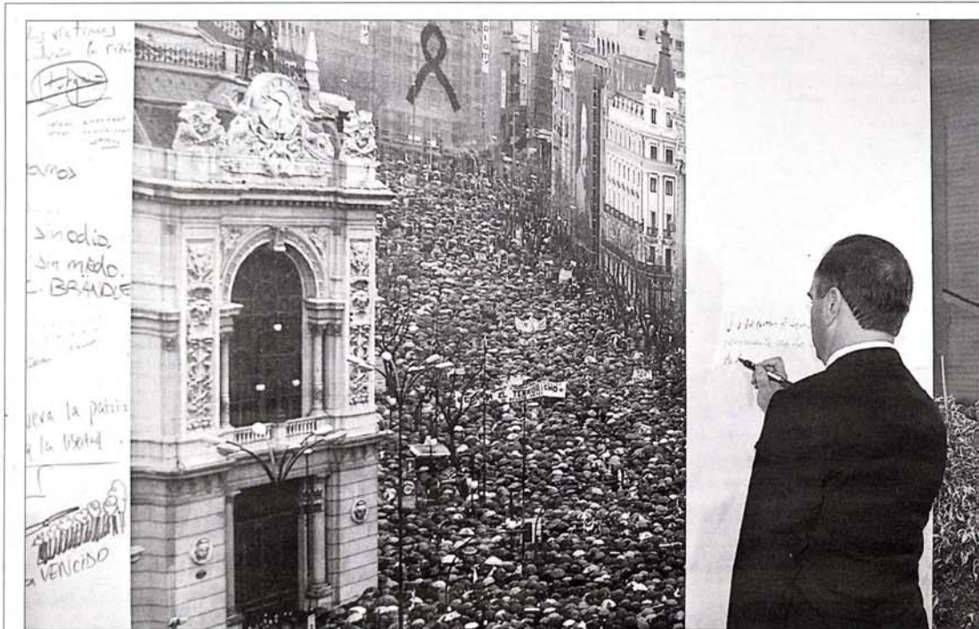
El ministro del Interior, José Antonio Alonso, escribe un mensaje en la inauguración de la exposición sobre el terrorismo que acoge la Casa de América.

La muestra tendrá un horario amplio de 11.00 a 00.00, de martes a domingos y los lunes hasta las 20.00, incluso en Navidades. La entrada costará tres euros, y uno, para niños y jubilados.