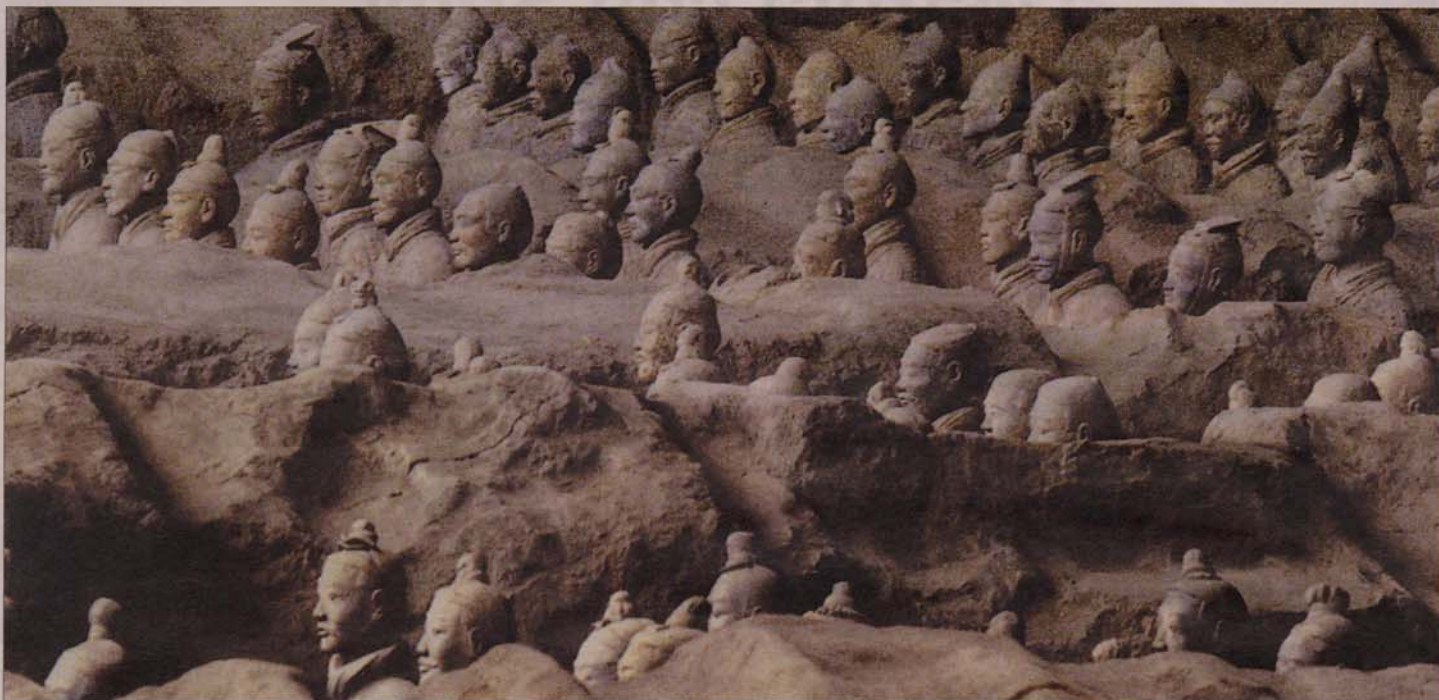
Una imagen del yacimiento donde descansan los 8.000 guerreros de terracota encargados de 'resguardar' la tumba del emperador chino Qin Shihuang.