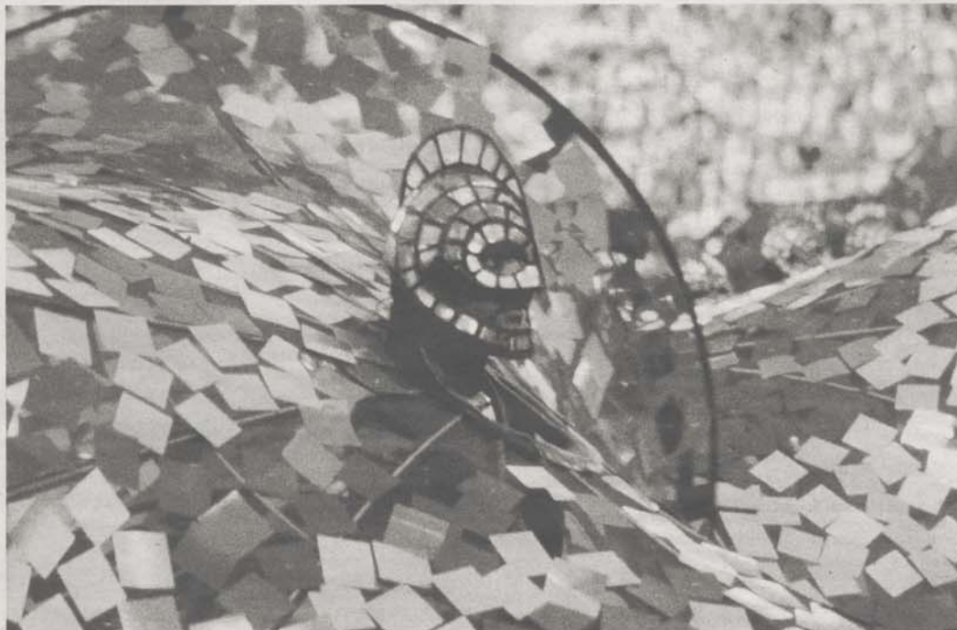
Con motivo del Día Mundial del Agua, la Fundación Canal inaugurará el próximo 22 de marzo la exposición «Água a escena»

Los melómanos tienen un apartado especial en el Canal Música, que reco-