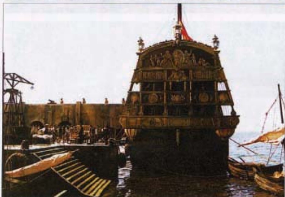
Galeón de 'El puente de San Luis rey'.