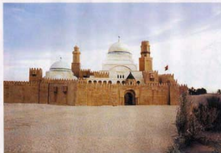
Lo único falso es el palacio.

falso puente con coches de juguete. Cuando se produjo el accidente, se rodó en directo, sin intervenciones digitales. Todo era real, el cielo, el río, los árboles de la orilla, lo único falso era el puente pequeño que se sobreponía al auténtico. "Sólo me to una pequeña mentira en la realidad. Un horizonte auténtico es insuperable", explica el truquista.