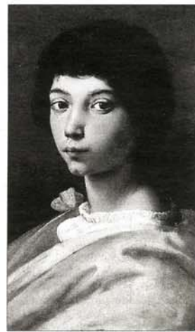
A la izquierda, 'Drugstore', de Hopper; a la derecha, 'Retrato de un joven', de Rafael, dos de las obras que forman parte de las exposiciones programadas por el Museo Thyssen-Bornemisza.