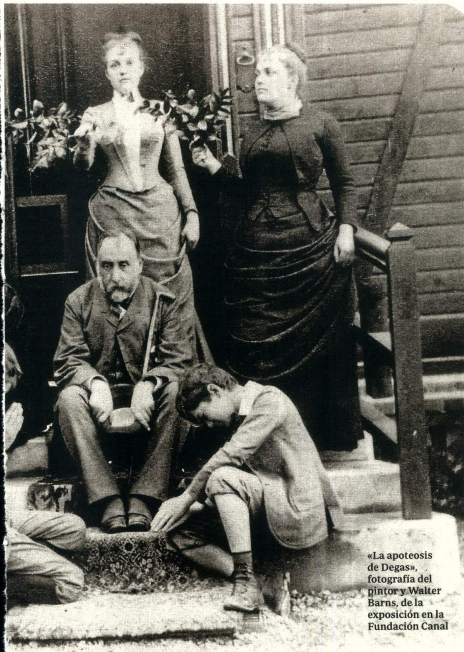
«La apoteosis de Degas», fotografía del pintor y Walter Barns, de la exposición en la Fundación Canal

cionadas por la expansión de la tecnología como son las nuestras. En ese marco, los ritmos de rechazo y aceptación se han producido muchísimo más rápido. Porque, como la vida en su conjunto, los cambios en el arte se han hecho también cada vez más veloces. Y no siempre son fácilmente comprensibles para segmentos amplios de la población.