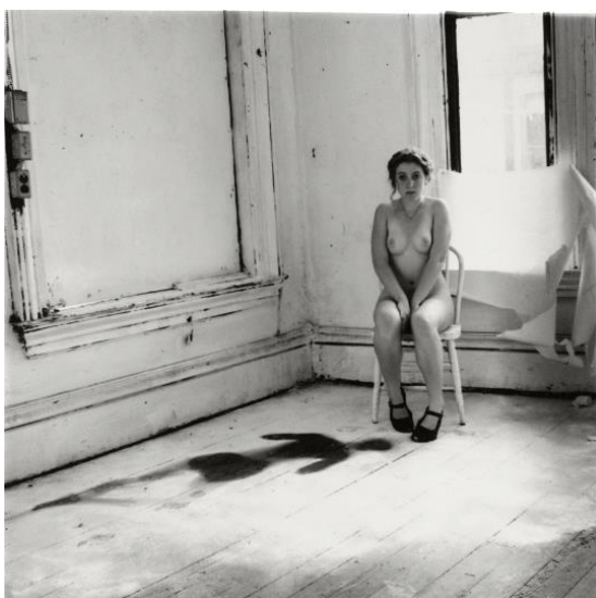
Sin título, Providence, Rhode Island, 1976

Sea cual fuere la razón, el caso es que los autorretratos de Francesca nos han transmitido una imagen sobre la propia artista que en muchas ocasiones se ha interpretado directamente en relación con su prematuro suicidio. Sin embargo, son muchos los expertos en su obra y allegados que invitan a centrarse solo en el contenido de sus fotografías a la hora de analizarlas sin tener en cuenta su trágico final. Por ejemplo, piden valorar los autorretratos de Francesca como fruto de la experimentación de una joven artista que realmente disfrutaba creando y en los que incluso se pueden apreciar muestras de su particular y excéntrico sentido del humor.