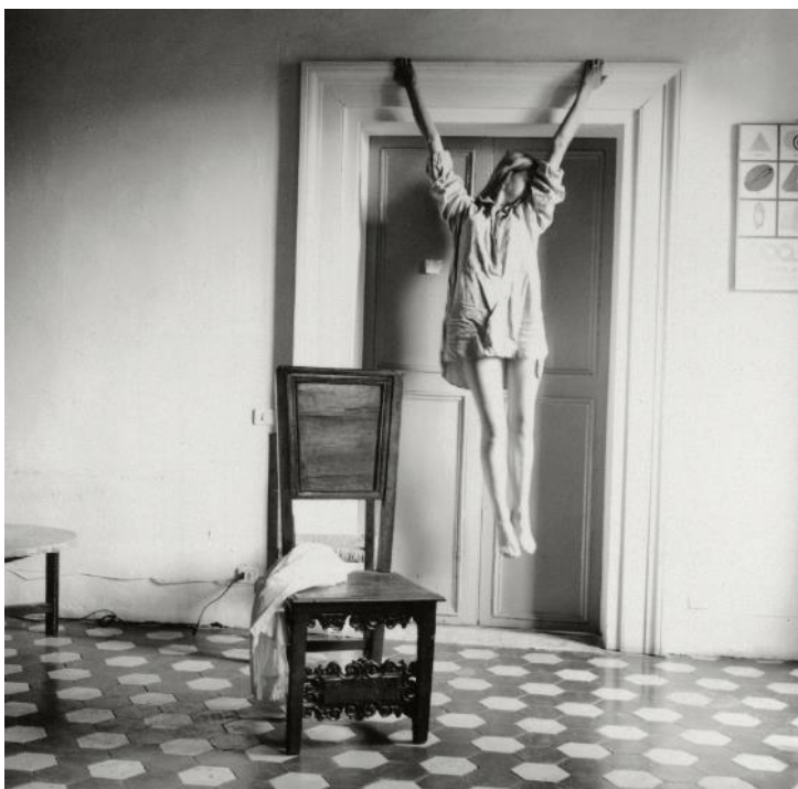
Sin título, Roma, Italia, 1977-78

De ella se ha dicho que era excéntrica, introvertida, apasionada, carismática, provocadora, muy teatral, que estaba frenéticamente obsesionada con su imagen y con la búsqueda del yo... Hablamos de la indescifrable Francesca Woodman (Denver, 1958 - Nueva York, 1981).