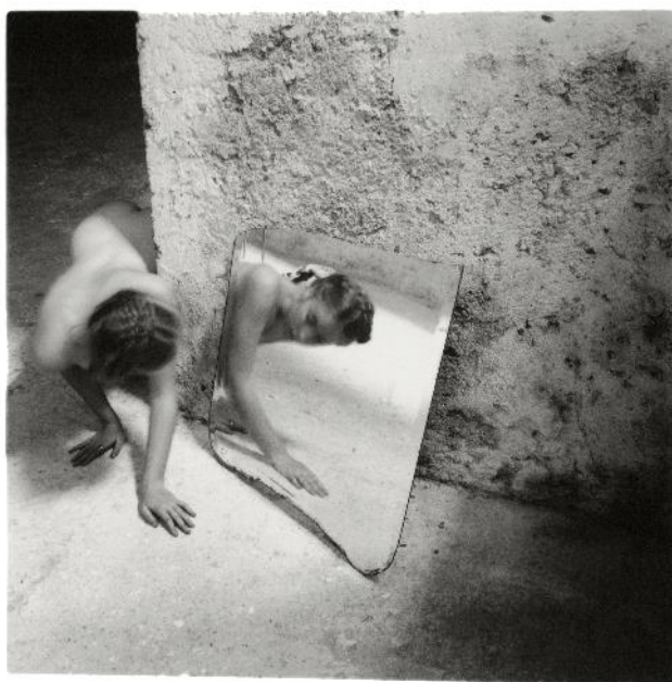
Autoengaño n.º 1, Roma, Italia, 1978

Presentación a medios: 2 de octubre de 2019. 10 horas. Apertura al público: Del 3 de octubre de 2019 al 5 de enero de 2020. ENTRADA LIBRE Laborables y festivos: 11:00 - 20 h. Miércoles: hasta las 15 horas. Sala Mateo Inurria, 2 Comisaria: Anna Tellgren, conservadora en el Moderna Museet, Estocolmo