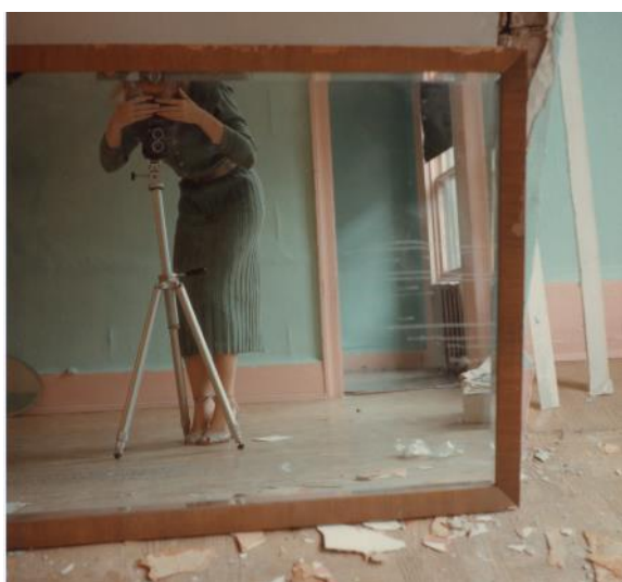
Sin título, Nueva York, 1979

La madurez artística la alcanza irónicamente durante lo que se supone que es su periodo de formación, cuando pasa a ser estudiante de la Rhode Island School of Design (RISD) en Providence, Rhode Island , una de las escuelas de arte más antiguas de Estados Unidos. Allí recibió clases del reconocido fotógrafo Aaron Siskind.