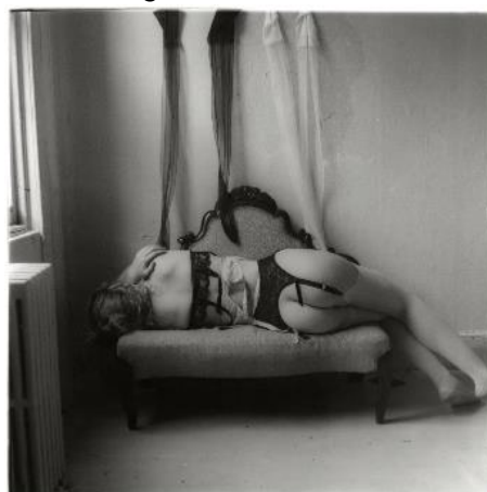
Sin título, Nueva York, 1979-80

El enigma que siempre rodea a Francesca Woodman incita a que surjan todo tipo de interpretaciones acerca de sus trabajos. En algunas de sus imágenes podemos apreciar como aparece la figura de la mujer de una manera rupturista respecto al rol que tradicionalmente se ha establecido a lo largo de la historia del arte. Algunos autores interpretan estos trabajos como una reivindicación del papel de la mujer en el mundo del Arte, como también hicieron, a