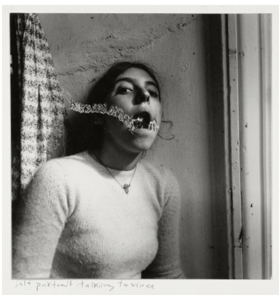
Autorretrato hablando con Vince, Providence, Rhode Island, 1977

El reconocimiento artístico de Francesca Woodman empezó a producirse poco después de su muerte. Una de las fechas claves sería 1986, cuando se celebró en el museo del Wellesley College la primera gran retrospectiva de la obra de Francesca Woodman, organizada por Ann Gabhart en colaboración con Rosalind Krauss. La muestra recorrió más tarde varios museos universitarios estadounidenses. Sus primeras exposiciones europeas tuvieron lugar en 1992, en el Shedhalle de Zúrich y el Westfälischer Kunstverein de Münster (Alemania), organizándose otra muestra 1993 en el Kulturhuset de Estocolmo, que después recalaría en el Museo Finlandés de Fotografía. El éxito de las imágenes de Francesca desde entonces ha sido imparable y, hasta la fecha, se han celebrado en Europa y Estados Unidos al menos medio centenar de exposiciones distintas sobre la obra fotográfica de Woodman, siendo la última de ellas la que acoge la Fundación Canal.