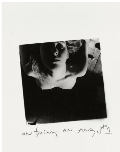
Ser un ángel n.º 1, Providence, Rhode Island, 1977