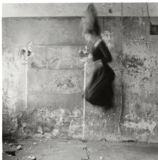
Sin título, Roma, Italia, 1977-78

Francesca Woodman entendía las fotografías como fragmentos de historias. Por este motivo, muchas de sus instantáneas transmiten una sensación de movimiento, que era la manera que tenía la artista de transmitir el tiempo a través de la imagen fija. Esto se aprecia claramente a lo largo la exposición en imágenes como Sin título, Roma, Italia, 1977-78 , en la que la vemos en pleno salto, como si se levantara a sí misma tirándose del pelo, o en sus imágenes de ángeles, en algunas de las cuales se sugiere tanto el movimiento como la capacidad de volar.