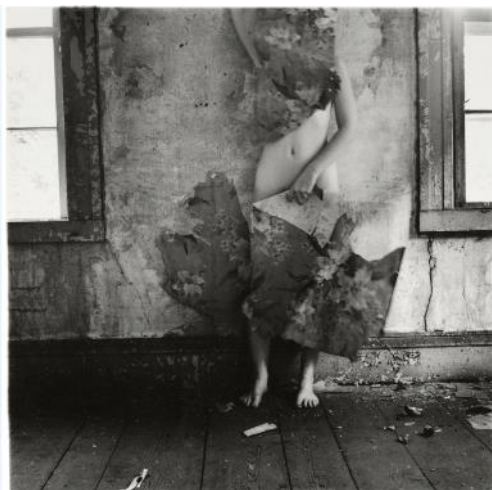
Desde Space2, Providence, Rhode Island, 1976